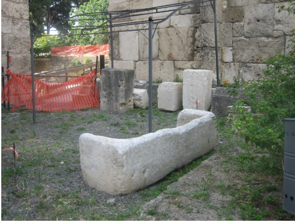
Fig. 3 - Sarcophago di Bonifatius (foto di Unicity S.p.A.).