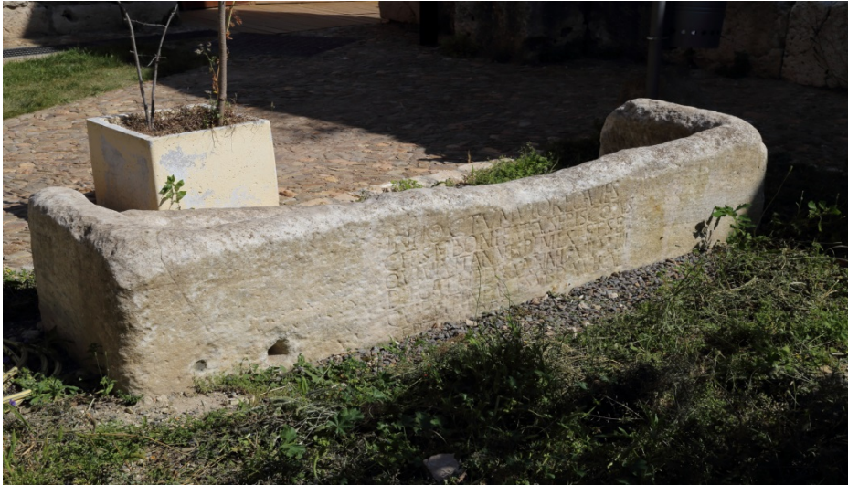
Fig. 1 - Sarcophago di Bonifatius.

cato che aiutava il vescovo nella gestione della diocesi), un archipresbiter , un notarius sub-regionarius et rector (depositario degli atti pubblici e stretto collaboratore del defensor), un clericus e forse un lector . Inoltre, altri ecclesiastici sono menzionati nelle trascrizioni seicentesche.