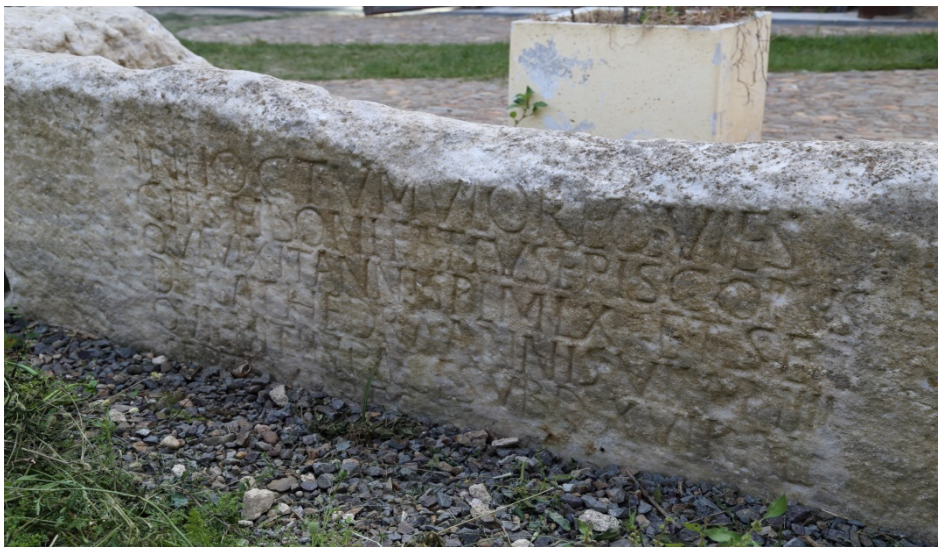
Fig. 2 - Sarcophago di Bonifatius.