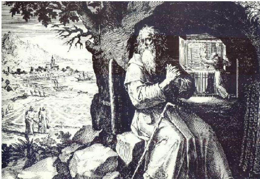
Fig. 2 - Fulgenzio di Ruspe in una stampa di I. Sadeler, 1600

La sua vita è stata descritta in un'opera databile al 533 circa, giunta a noi in forma anonima, ma attribuita al diacono Ferrando, suo alunno, che lo seguì in esilio a Cagliari. Ferrando, rientrato in Africa nel 523, divenne diacono a Cartagine e, forse, anche vescovo.