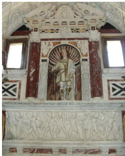
Fig. 2 - L'altare di S. Saturnino nel "Santuario dei Martiri" del Duomo di Cagliari.

San Saturnino è il patrono di Cagliari e viene festeggiato il 30 ottobre.