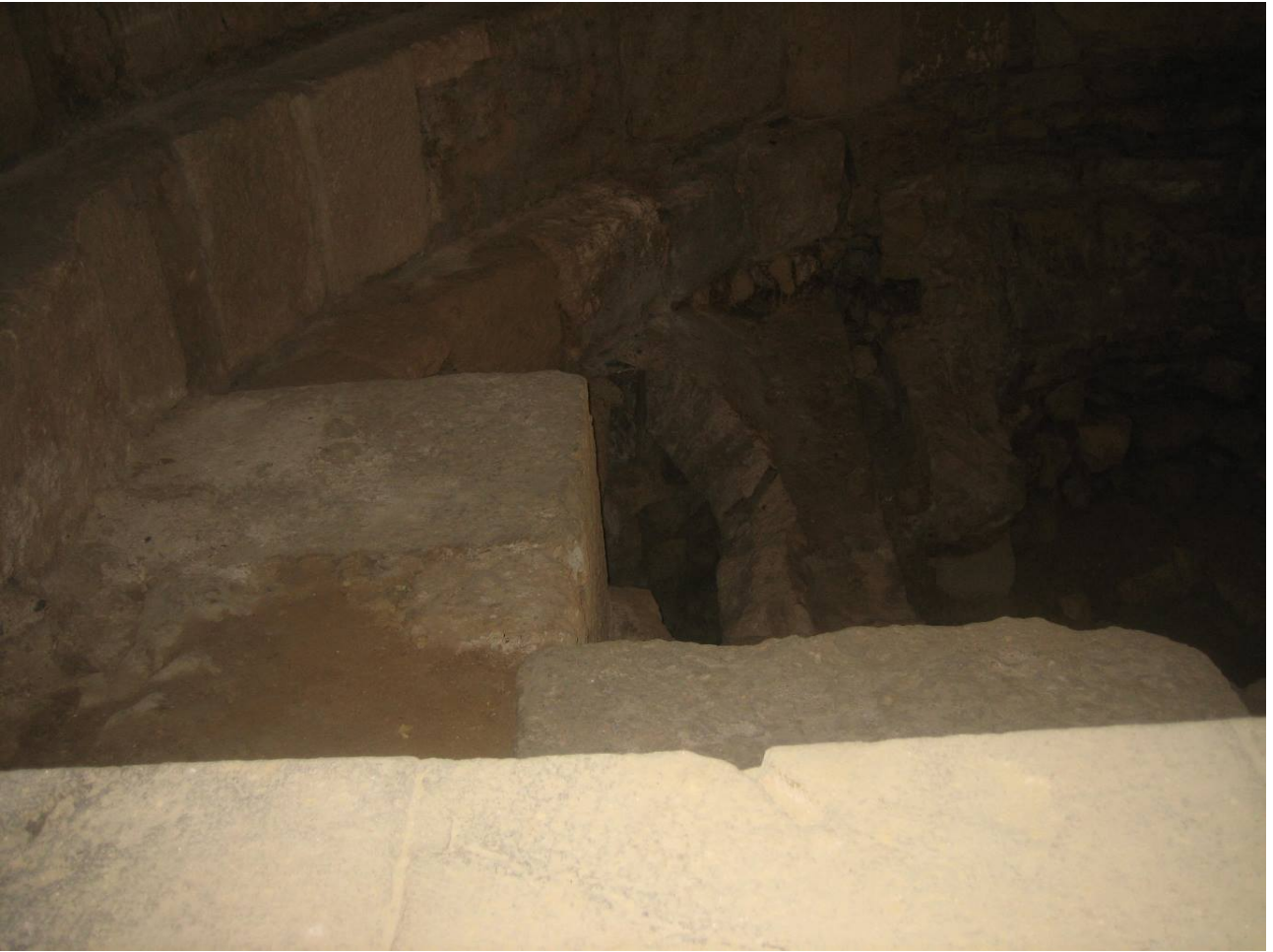
Fig. 3 - Ciò che rimane al di sotto del piano di calpestio attuale.