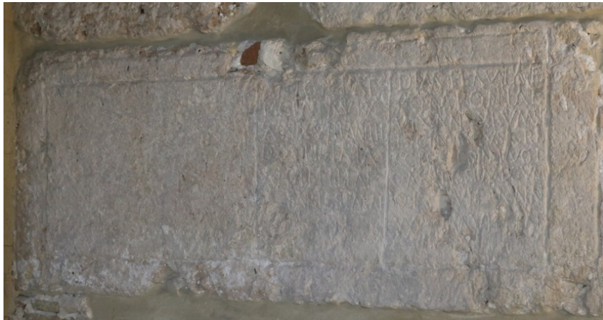
Fig. 3 - Dettaglio dello specchio epigrafico.