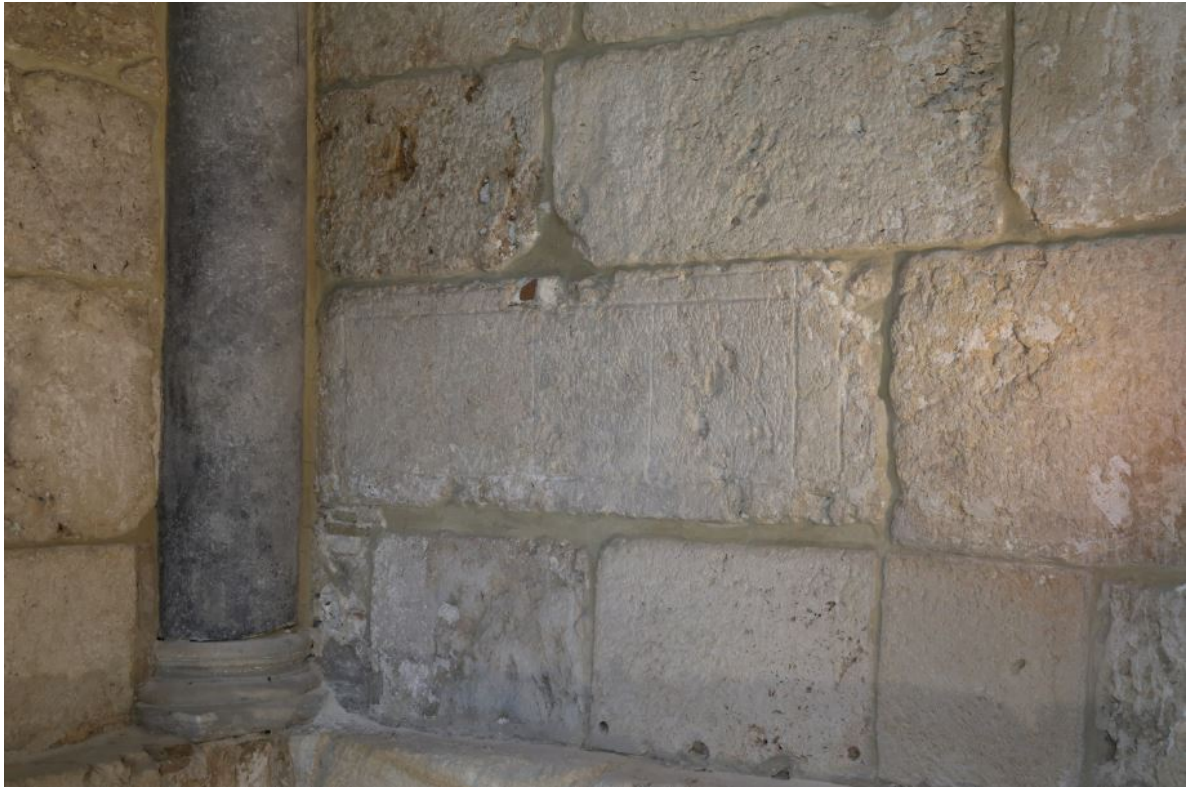
Fig. 2 - Elemento funerario con specchi epigrafici reimpiegato all'interno della navatella sinistra del braccio orientale.