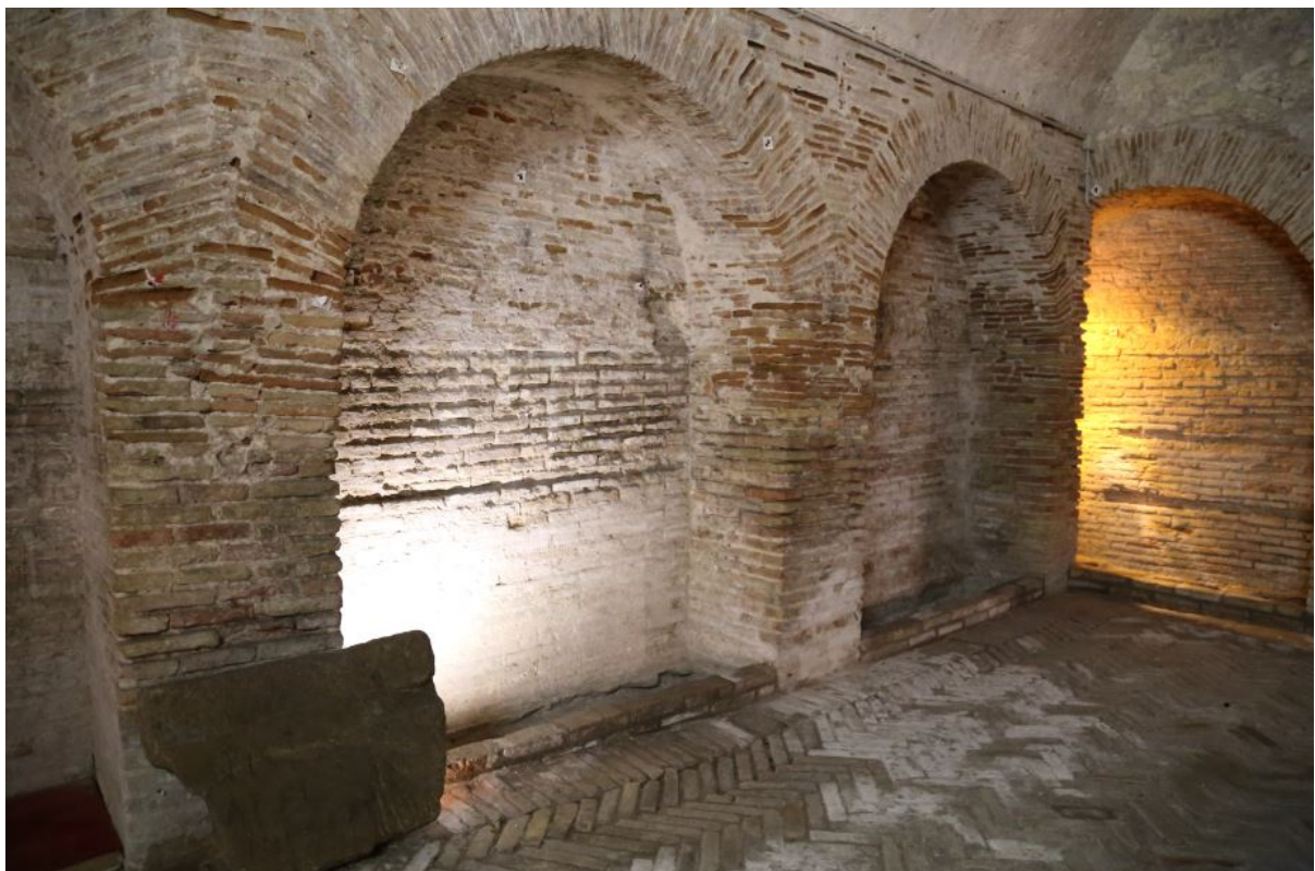
Fig. 2 - Seconda chiesa sotterranea, interno.

L'uso primario della struttura si colloca tra il IV e il VII secolo.