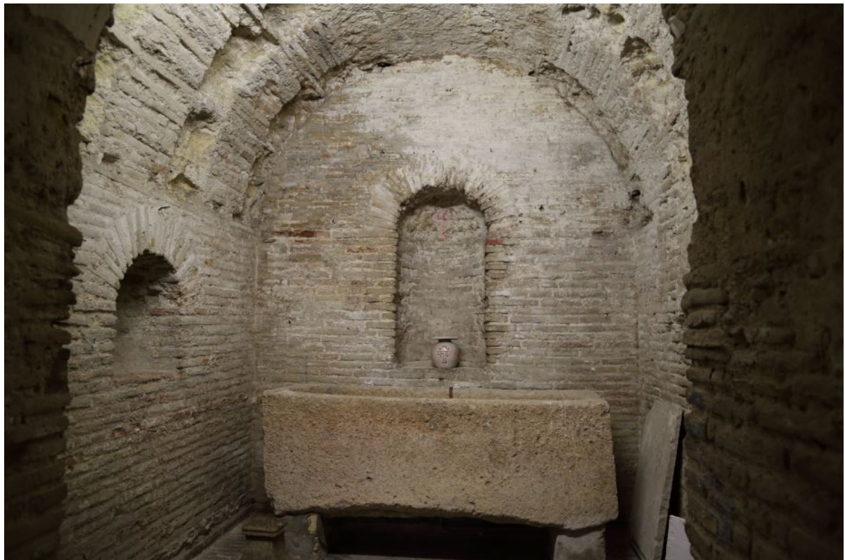
Fig. 3 - Seconda chiesa sotterranea: "capilla maior".