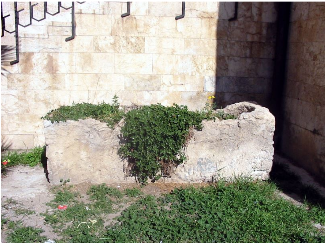
Fig. 4 - Sarcofago a cassa.