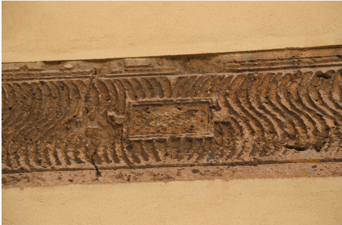
Fig. 3 - Sarcofago strigilato con tabula ansata.