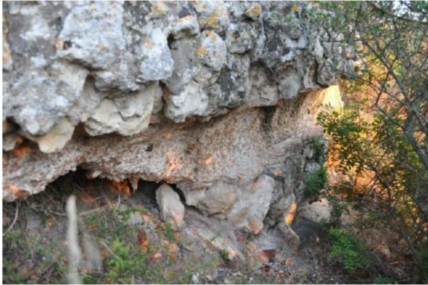
Fig. 5 - Tratto dell'acquedotto (da Fantauzzi, De Vincenzo 2013, p. 3, fig. 3).

a breve distanza dall'impianto termale 12 . La costruzione di opere pubbliche - come appunto gli acquedotti o le mura - avveniva per volere degli imperatori: questi lavori dovevano essere ricordati e associati al nome del committente imperiale tramite epigrafi 13 .