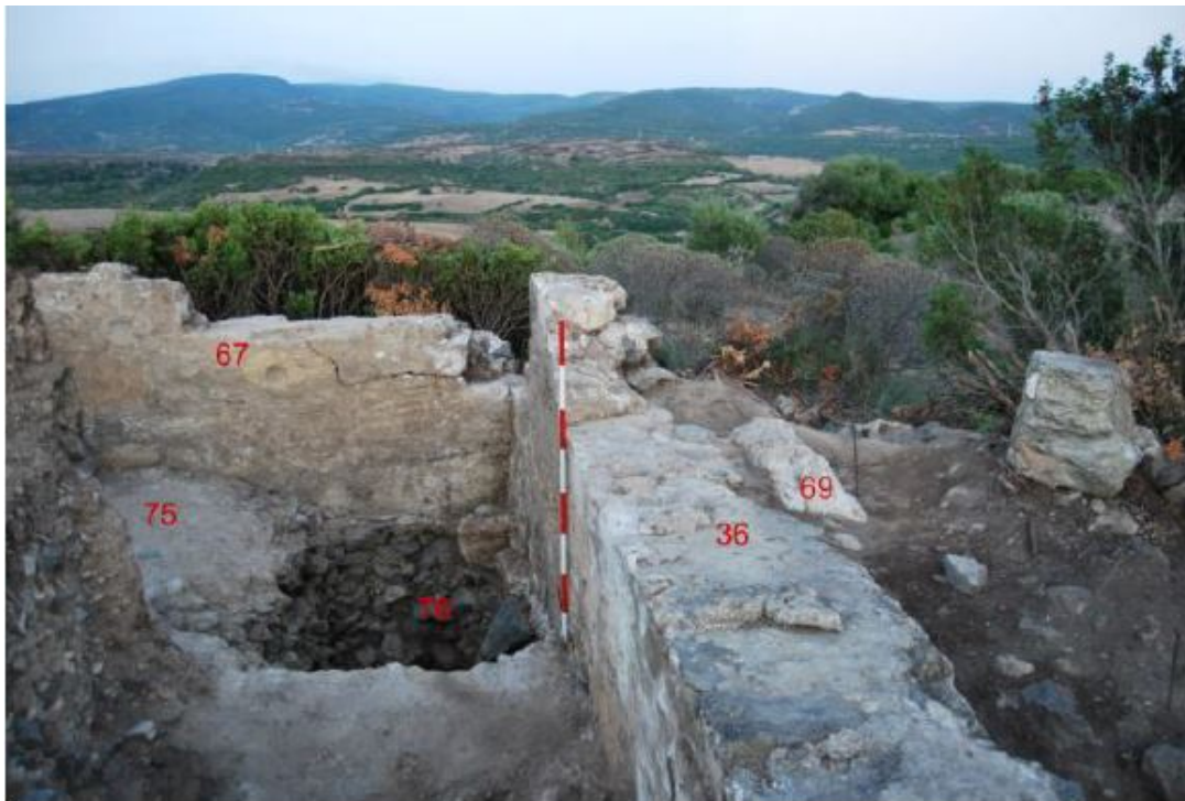
Fig. 4 - Corchinas, settore nord-orientale del colle: strutture termali (da Fantauzzi, De Vincenzo 2013, p. 12, fig. 16).

realizzati in opera cementizia e blocchi legati con malta e rifasciati all'esterno da conci calcarei di grandi dimensioni.