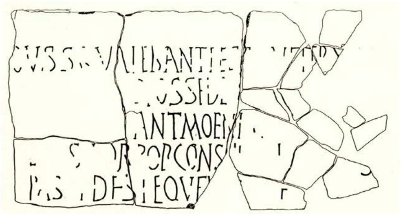
Fig. 2 - Restituzione grafica dell'epigrafe: lato menzionante moenia (da Sotgiu 1990, p. 208, fig. 2).

La faccia celata per diversi secoli nella terra (fig. 3) mostra invece un testo databile 6 : Salvis d(ominis) n(ostris tribus) Flaviis Gratiano, V[alentiniano / The]jodosio, invictissimis princip[ibus. Thermae] / aestivae quae olim squalor[e et magna] / ruina fuerant conlapsae a [fundamentis (?)] / constitut[ae] nunc de fonte du[---] ovvero al tempo in cui erano imperatori Graziano, Valentiniano e Teodosio (379-384), le terme estive che da tempo erano cadute in rovina furono restaurate 7 .