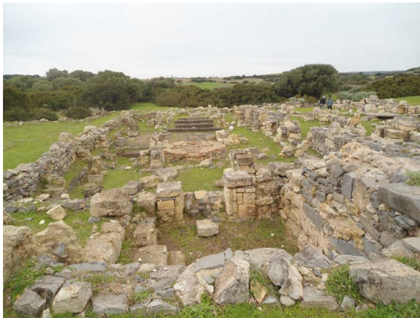
Fig. 1 - Basilica battisteriale, veduta da Est.

Durante le indagini del 1964 effettuate nella basilica preposta allo svolgimento del rito battesimale (fig. 1) 1 vennero individuati nel pavimento sedici frammenti di un'epigrafe in marmo 2 . Solo al momento del recupero è stato possibile notare che il manufatto fosse opistografo 3 : il testo epigrafico appare di difficile lettura sul lato calpestato dai fedeli che transitavano nella basilica e sembra potersi riferire al restauro o alla costruzione di mura urbiche 4 , infatti nella quarta linea si individua chiaramente la parola moen[ā] , «mura», preceduta da ant , probabile finale di un verbo, che potrebbe essere anche [fecer]ant, «avevano fatto» (fig. 2). Tale riferimento secondo L. Pani Ermini sarebbe da intendersi come l'attestazione del restauro subito dalle murature del battistero stesso 5 .