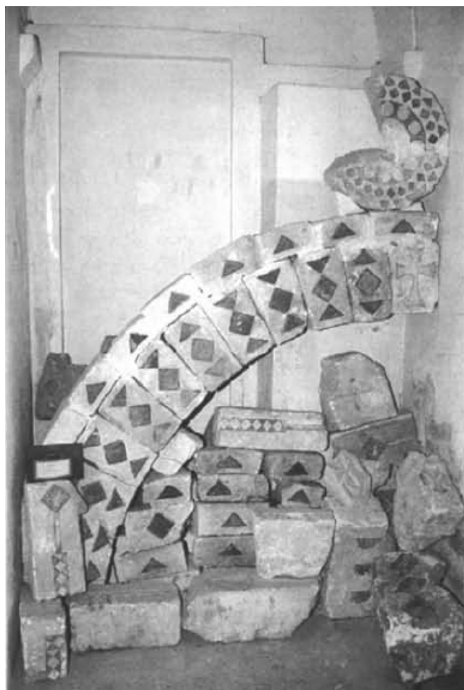
Fig. 5 - Elementi architettonici in calcare con intarsi geometrici in trachite rossa (da Spanu 1998, p. 103).

Infine sono documentati elementi dalla decorazione scultorea fra i quali sono i capitelli-imposta, le mensole con foglia d'acanto, un capitello con pesci, una mensola sbozzata nel torso di una statua e un capitello-imposta che nella faccia lunga mantiene il decoro del manufatto da cui fu ricavato 16 .