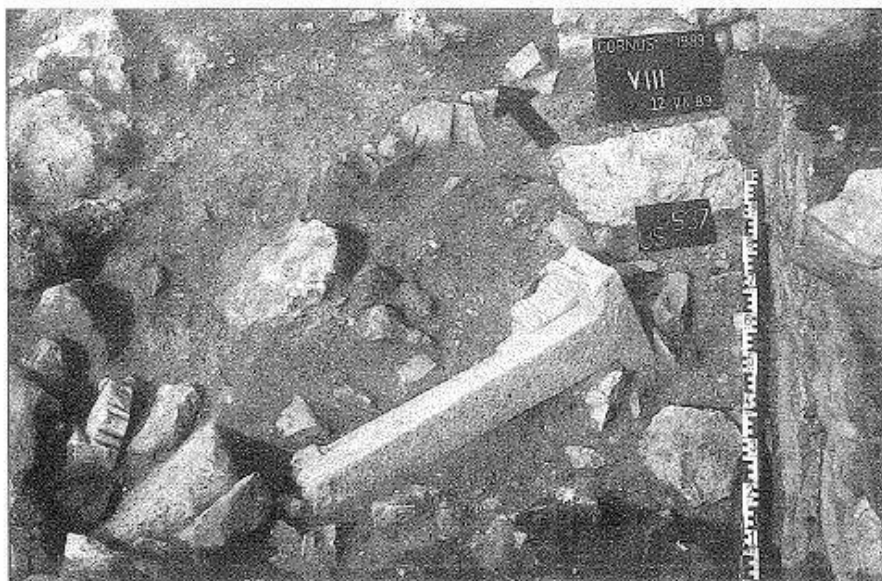
Fig. 2 - Bottega dello scalpellino (da Cornus I.1, p. 44, fig. 27).

Ha fatto propendere per tale funzione la presenza al suo interno di materiale litico fra cui del pezzame non lavorato, elementi per lo più di tipo architettonico 3 , appena sbazzati 4 , altri di riutilizzo 5 , altri ancora pronti per essere impiegati 6 . I manufatti rinvenuti sono disparati: si tratta di elementi funerari come i sarcofagi, frammenti di arredo liturgico (mensa e relative colonnine) 7 ed architettonici (colonne, capitelli...) 8 . Alcuni frammenti analoghi a questi ultimi, e quindi provenienti dalla stessa bottega, sono stati rinvenuti nel pastoforio settentrionale del battistero 9 dove è probabile che potessero essere pronti per l'utilizzo durante il restauro di una o di entrambe le aule di culto chiesa romanica 10 - mai