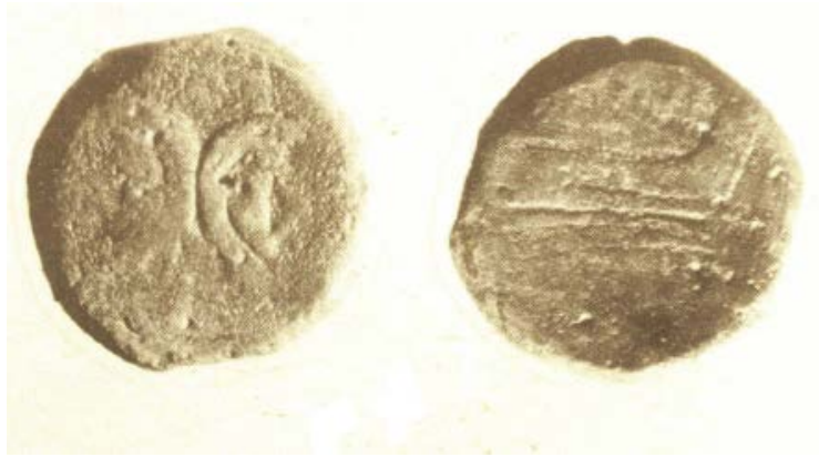
Fig. 2 - Columbaris - Settore VI: asse della zecca di Roma (217-197 a.C.), (da CUGLIERI I, tav. XXXVIII).

Gli esemplari di epoca romana imperiale (figg. 3-5) si datano dal III d. C. fino al VI secolo d.C. e quelli pertinenti agli imperatori da Gallieno (253-258 d.C.) a Giustiniano I (527-565 d.C.) sono i più numerosi. Inoltre, sono state rinvenute ventotto monete vandale, delle quali due sono protovandale, le restanti si riferiscono ai regni di Gutamondo (484-496 d.C.), Trasamondo (496-523 d.C - fig. 6 - e Ilderico (523-530 d.C.) 1 .