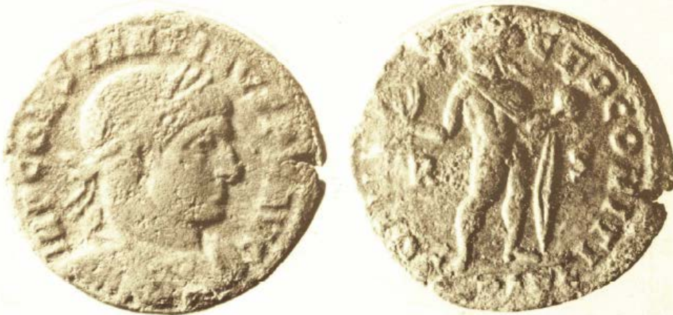
Fig. 3 - Columbaris - Settore IV, 1: aes di Costantino, 317 d.C., (da CUGLIERI I, tav. XXXIX).

Gli esemplari di epoca romana imperiale (figg. 3-5) si datano dal III d. C. fino al VI secolo d.C. e quelli pertinenti agli imperatori da Gallieno (253-258 d.C.) a Giustiniano I (527-565 d.C.) sono i più numerosi. Inoltre, sono state rinvenute ventotto monete vandale, delle quali due sono protovandale, le restanti si riferiscono ai regni di Gutamondo (484-496 d.C.), Trasamondo (496-523 d.C - fig. 6 - e Ilderico (523-530 d.C.) 1 .