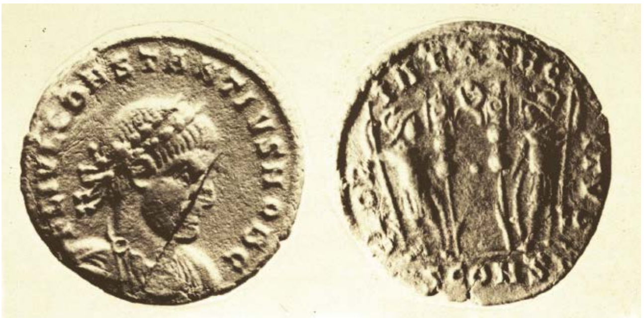
Fig. 5 - Columbaris - Settore IV, 1: aes di Costanzo II, 330-335 d.C. (da CUGLIERI I, tav. XLI).