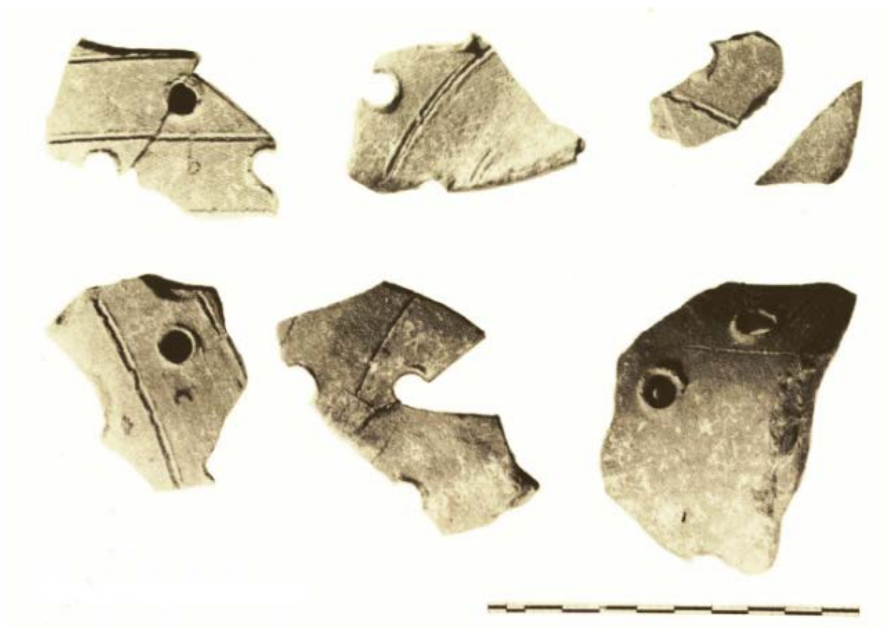
Fig. 1 - Columbaris, area cimiteriale: frammenti di portalampada (da GIUNTELLA et al. 1985, p. 78, fig. 70).

Dalla mensa a ridosso del sarcofago n. 17 e dal tumulo quadrangolare con mensa relativa alle tombe n. 20 e n. 21 dell'area cimiteriale di Columbaris provengono alcuni frammenti ceramici (fig. 1) che, per il tipo dell'impasto, la decorazione a stecca, le dimensioni e soprattutto per la disposizione dei fori sulle pareti, permettono di ipotizzare la pertinenza a portalampada palestinesi 1 .