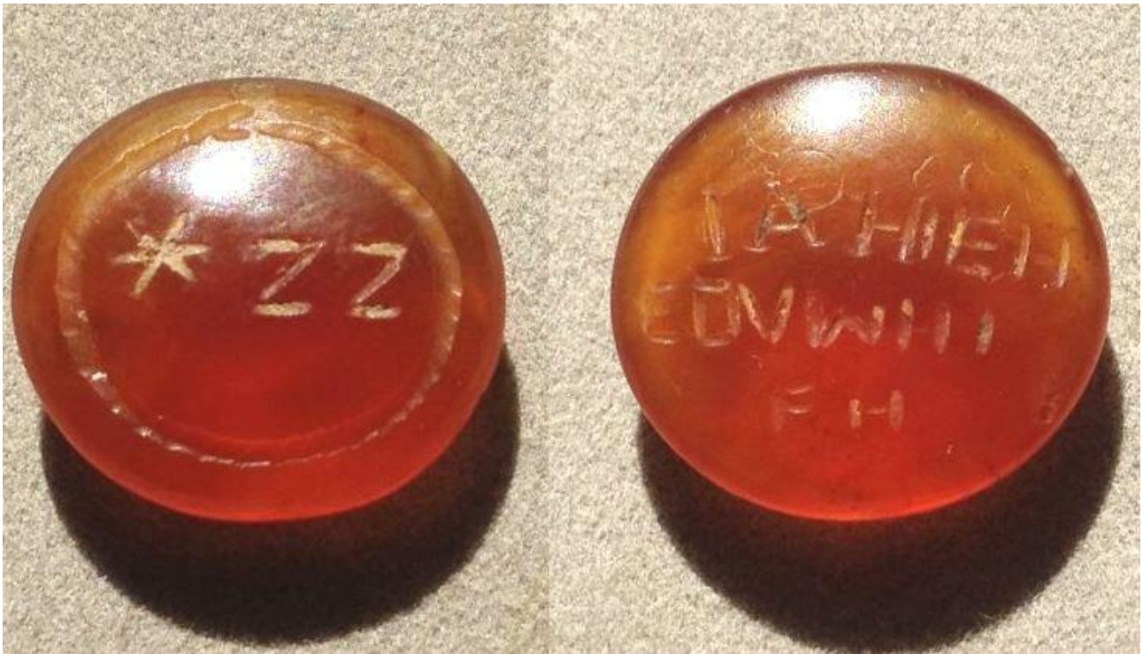
Fig. 3 - Gemma magica con Ouroboros , IL_Landau Collection_8.

La sua vicinanza ad oggetti riconducibili alla setta gnostica non costituisce un'attribuzione certa dell'esemplare cornuense a tale filosofia: sembra invece accostabile alla categoria delle gemme "magiche". Attraverso le formule scritte, tali manufatti avevano la finalità di proteggere il proprietario, quali oggetti legati alla magia bianca 12 : si tratta di elementi di superstizione ereditati dal mondo pagano, che continuarono ad essere utilizzati anche dopo l'affermazione del Cristianesimo. Le gemme gnostiche non sono note prima del III secolo d.C. e sono attestate per tutta l'età bizantina 13 . In Sardegna sono stati rinvenuti oggetti analoghi da Tharros, Cabras (fig. 4) e da Terralba (fig. 5) 14 ed esemplari