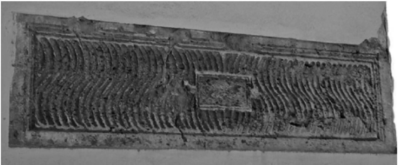
Fig. 3 - Cagliari, chiesa di San Lucifero: sarcofago strigilato in calcare con tabula ansata (da TEATINI 2008, p. 1310, fig. 9).

Questi elementi formali rivelano la fattura africana, forse addirittura da marmorari cartaginesi per la decorazione disposta unicamente sulla faccia principale (figg. 4-5) 9 .