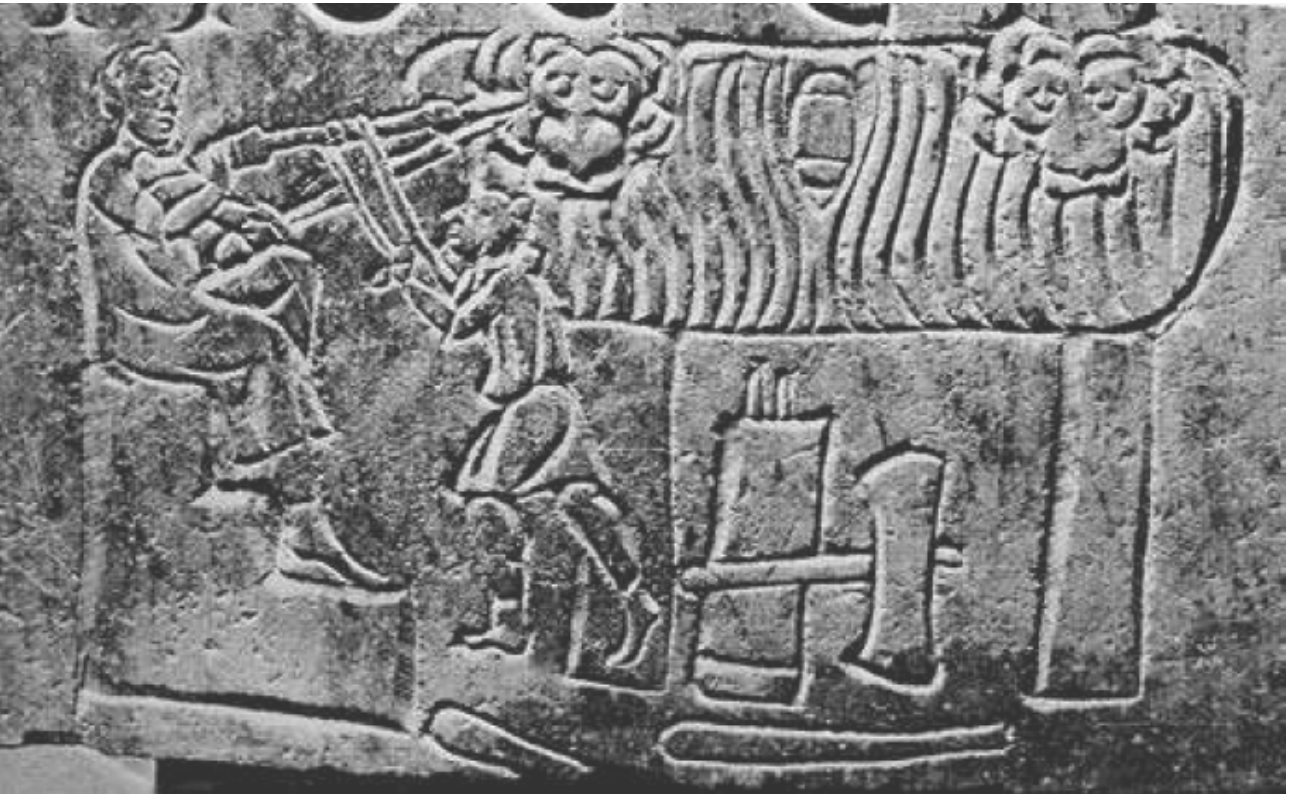
Fig. 5 - Particolare della lastra di Eutropos, nella quale è raffigurata la bottega di un marmorarius (da BARATTA 2007, p. 212, fig. 28).