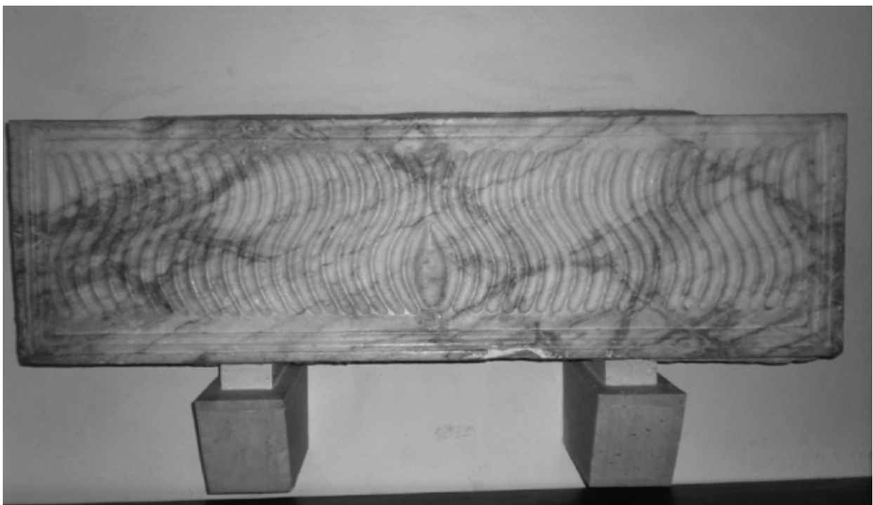
Fig. 2 - Pula, Parrocchiale di S. Giovanni Battista: sarcofago strigilato in marmo (da TEATINI 2008, p. 1307, fig. 6).

zione, su una delle due testate maggiori vennero praticati un foro sul fondo e una sbrecciatura nell'orlo superiore per il deflusso dell'acqua 5 . La cassa è delimitata da una cornice sui due lati brevi e su quello lungo superiore, andando ad inquadrare l'area decorata da due serie di strigilature divergenti verso le estremità e suddivisa in due parti da un motivo centrale a mandorla posto nello spazio inferiore 6 . L'andamento del motivo ondulato è una variante rispetto alla classe dei sarcofagi strigilati 7 - che la prevedono solitamente convergente verso il centro - ma allo stesso tempo si dimostra come un cliché negli esemplari sardi rispondenti a questa categoria (figg. 2-3) 8 .