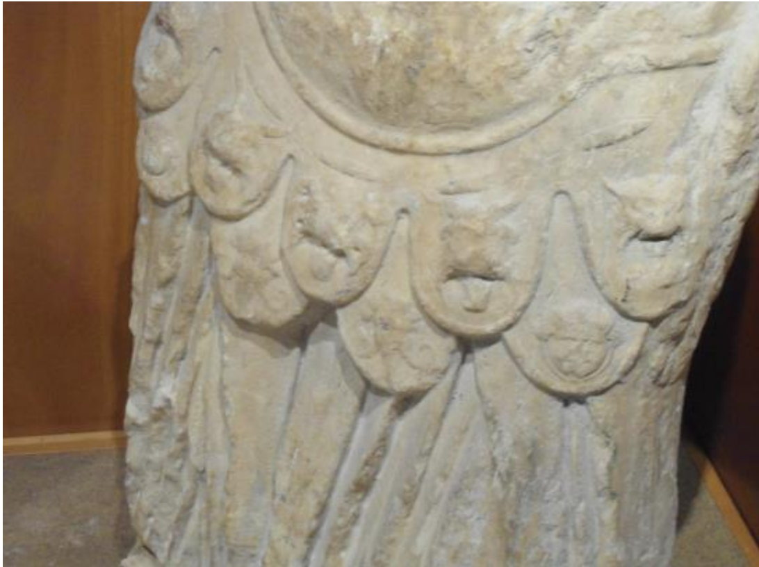
Fig. 2 - Oristano, Antiquarium Arboreense : particolare degli pteryges a linguetta nella statua cornuense.

Di quest'ultima statua si conserva solo il torso e una parte degli arti inferiori. Il personaggio indossa una tunica e al di sopra la corazza anatomica. La decorazione della lorica 5 è costituita, a partire dall'alto, da una piccola egida con il bordo formato da serpenti annodati e al centro un Gorgoneion ; nella parte centrale del busto si possono ancora notare due grifi affrontati con candelabro centrale (cfr. fig. 3), tipologia che abbraccia un arco temporale compreso tra l'età tiberiana e quella antoniniana 6 . Una doppia fila di pteryges (frange) a linguetta copre il bacino (fig. 2). Le caratteristiche formali e stilistiche hanno portato a proporre una datazione al I d.C. circa, nonostante vi sia un'ulteriore ipotesi che riporterebbe l'opera ai principati di Domiziano (51-96 d.C.) e Traiano (97-113 d.C.) 7 .