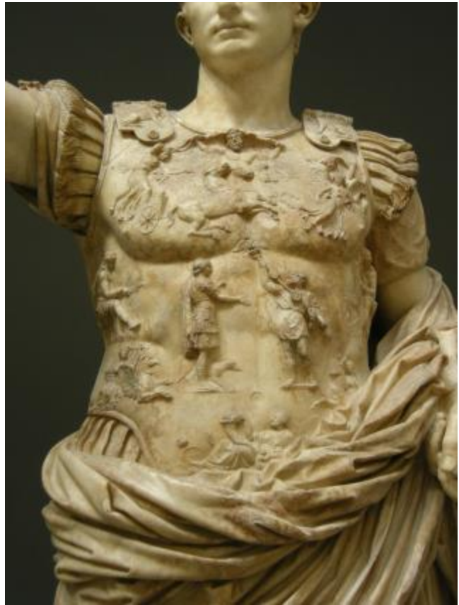
Fig. 5 - Roma, Musei Vaticani: Augusto di Prima Porta e dettaglio della sua corazza istoriata.