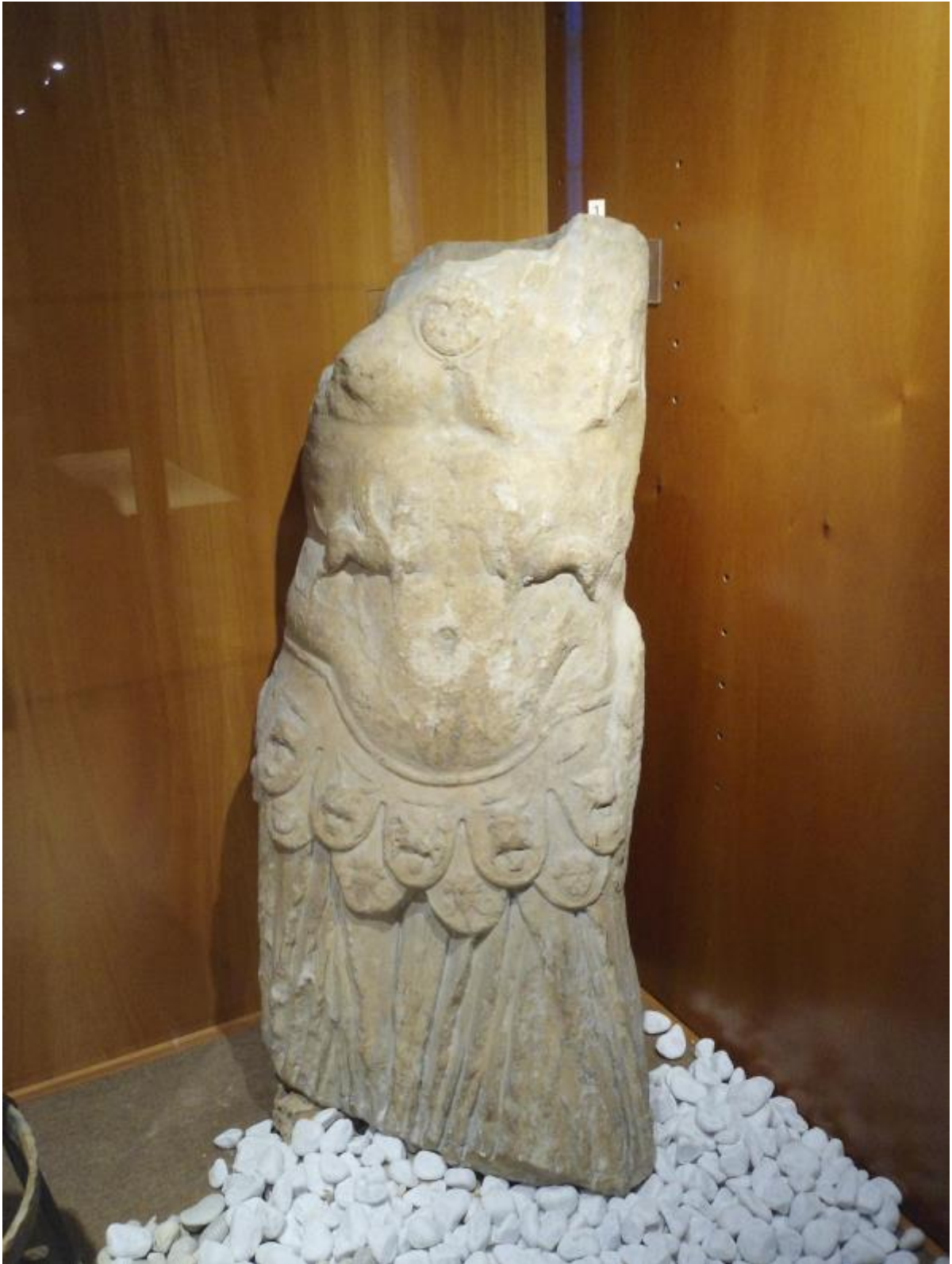
Fig. 1 - Oristano, Antiquarium Arborense : statua di loricato da Cornus.