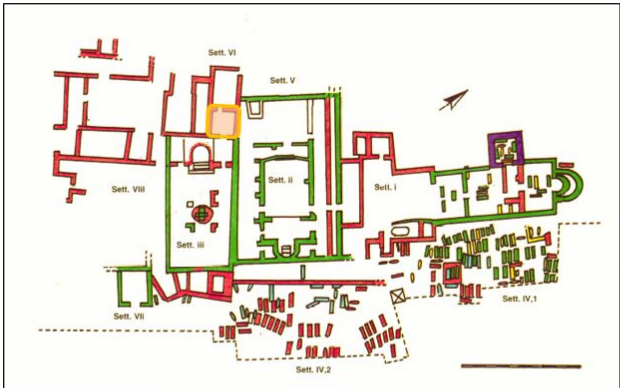
Fig. 1 - Pianta dell'area di Columbaris, in cui è evidenziato il luogo di ritrovamento del cucchiaino (rielaborazione grafica C. Cocco, F. Collu, da Cornus I,1, p. 200, Tav. II).

utilizzato nelle Sacre Scritture per connotare Dio e Cristo. Da tale sentimento nasce il rituale omonimo, spesso tenuto in ambito cimiteriale, presso le tombe venerate o di defunti cari: esso riguarda un banchetto di tipo spirituale, in cui si celebra il sacramento dell'Eucarestia, oltre a quello conviviale, in cui veniva consumato un vero e proprio pasto (TESTINI 1980, pp. 143-144; COSENTINO 1997, pp. 1-12; Cornus I.2, p. 14; FAVA 2010-2011, pp. 6-7).