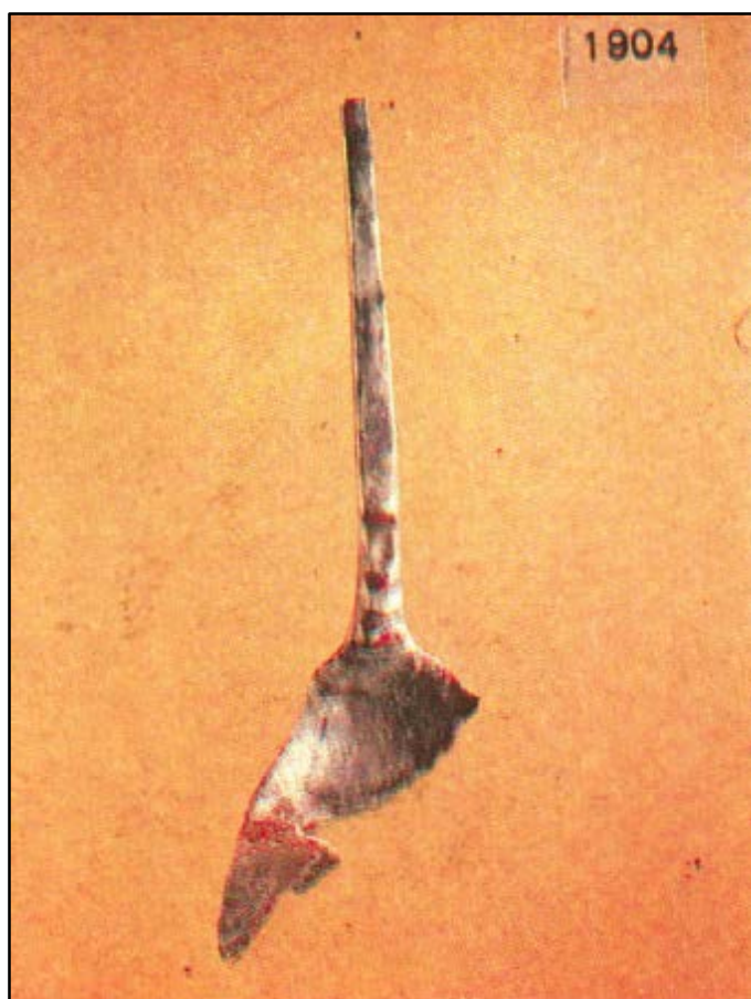
Fig. 2 - Cornus: cucchiaino d'argento (da CUGLIERI I, fig. 21).