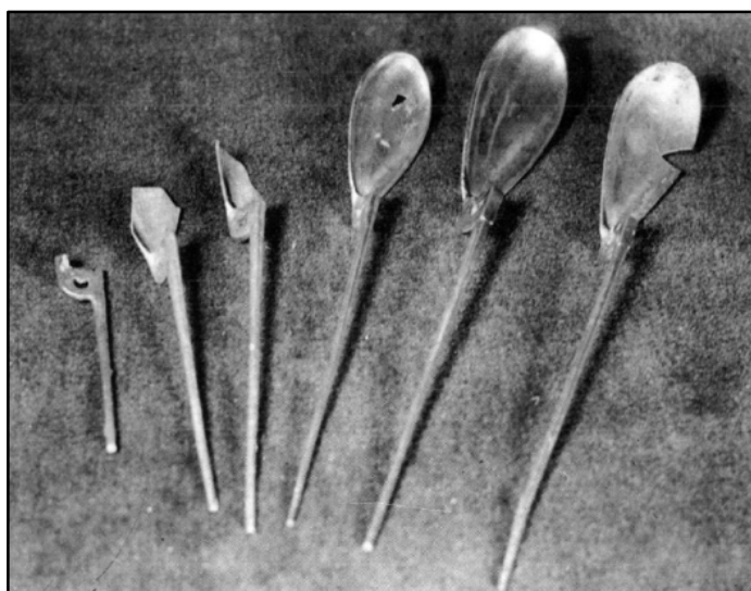
Fig. 3 - Cucchiaini dal tesoro di Sucidava (da RĂDULESCU LUNGU 1989, p. 2594, fig. 23).