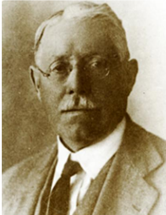
Fig. 1 - Antonio Taramelli.

Il sito archeologico di Cornus si lega all'illustre figura di Antonio Taramelli (Udine, 14 novembre 1868 – Roma, 7 maggio 1939), il quale dedicò la sua attività di ricerca alle antichità sarde, occupandosi inoltre di tutela e restauro dei beni culturali (figg. 1-2).