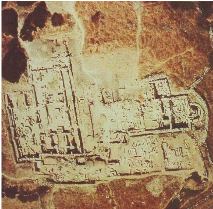
Fig. 2 - Cornus-Columbaris: veduta dall'alto dell'area delle basiliche (da Cornus I.1, p. 36, fig. 15).

La presenza di un' insula episcopalis 7 nel territorio di Cornus in località Columbaris (fig. 2), ha fatto ipotizzare che questa fosse la sede vescovile citata dalle fonti 8 . Tale diocesi compare alternativamente a quella di Cornus - attestata dal VI secolo - sino alla metà del VII d.C. 9 . A questi secoli si riporta l'istituzione di due ulteriori sedi, ovvero Tharros e Fausania, nei pressi di Olbia 10 .