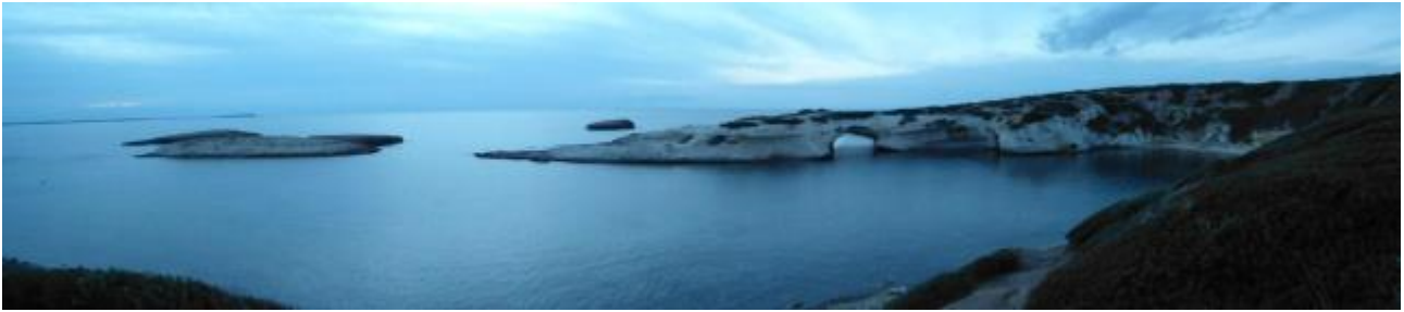
Fig. 2 - Veduta di S'Archittu.

Il tratto di costa che sembra poter rispondere a tutte le caratteristiche di tale infrastruttura (come l'altezza del fondale e la presenza di un sistema di secche e canali d'ingresso protetti dai venti) è quello del Capo Mannu, più precisamente la Cala Su Pallosu (fig. 3), a 5 miglia nautiche (circa 9 km) da Cornus. Inoltre, a livello etimologico, il Korakodes potrebbe andare a segnalare la presenza di cormorani o di pesci-corvo: la presenza di questi ultimi è attestata ancora oggi nell'Isola di Mal di Ventre. È stato ipotizzato che il Korakodes sia stato il punto d'attracco della flotta punica giunta in soccorso di Ampsicora durante la rivolta contro i romani del 215 a.C., e, se questo fosse stato nell'area del Capo Mannu, la distanza dal quartier generale dei ribelli, Cornus, sarebbe stata assai breve per l'esercito di Asdrubale.