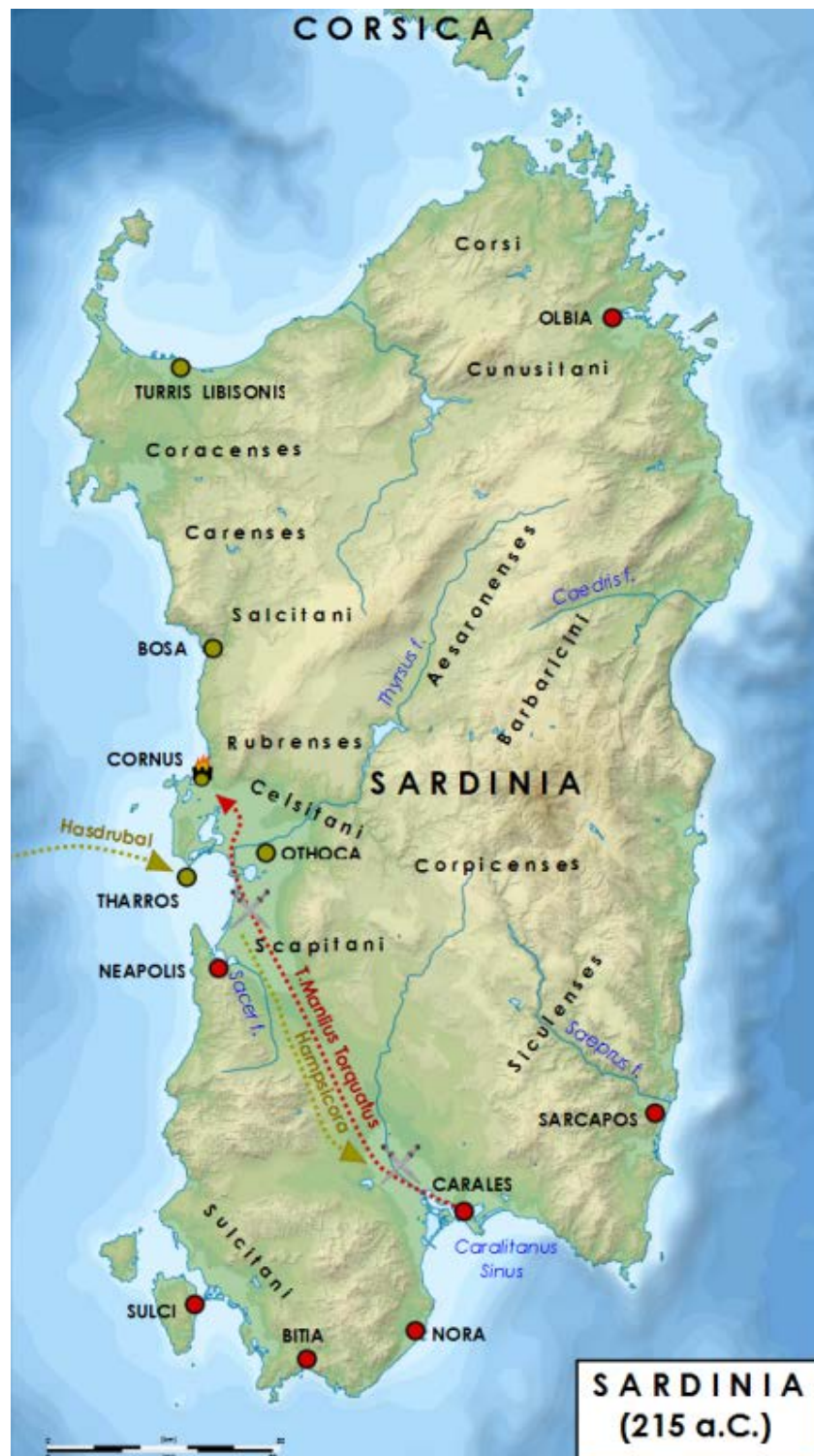
Fig. 5 - Percorso effettuato dalle truppe e campi di combattimento della Battaglia di Cornus.

esercito, comandato dal figlio Osto discendeva dalla parte settentrionale del Campidano alla volta di Cagliari.