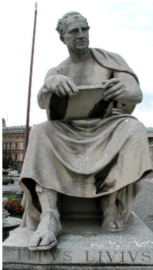
Fig. 4 - Statua di Tito Livio a Padova, suo paese natale ( http://www.miti3000.it/mito/libri/imagsd41d.htm?http://www.miti3000.it/mito/libri/img/Tito_Livio_Padova.gif ).

alcuni fatti storici da lui stesso narrati. Ulteriori dettagli circa gli episodi militari del 215 a. C. si desumono dall'opera del poeta Silio Italico 9 .