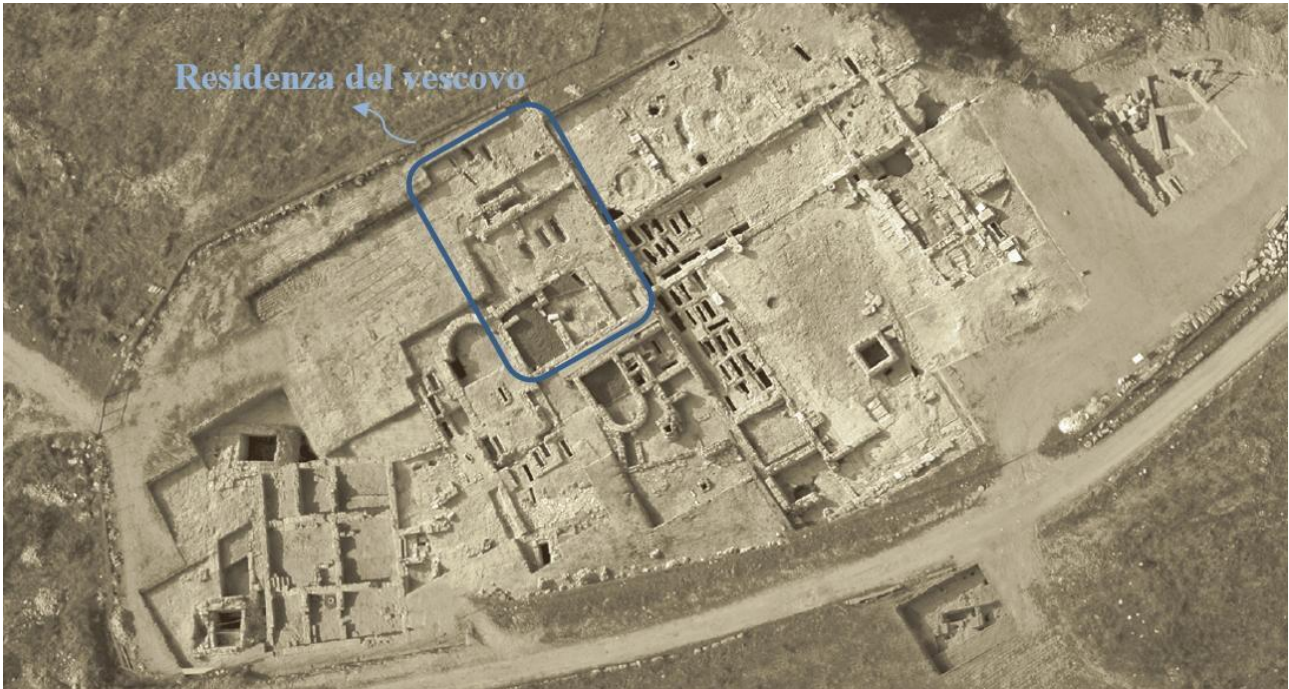
Fig. 6 - Veduta dall'alto del complesso paleocristiano di S. Pietro a Canosa (daVOLPE 2007, p. 135, fig. 135 - rielab. grafica F. Collu).

L'associazione presso un' insula episcopalis 13 della residenza vescovile e di ambienti destinati alle attività produttive è variamente riscontrata 14 , ad esempio nei casi di San Pietro a Canosa di Puglia (fig. 6) 15 e San Giusto nella valle del Celone 16 .