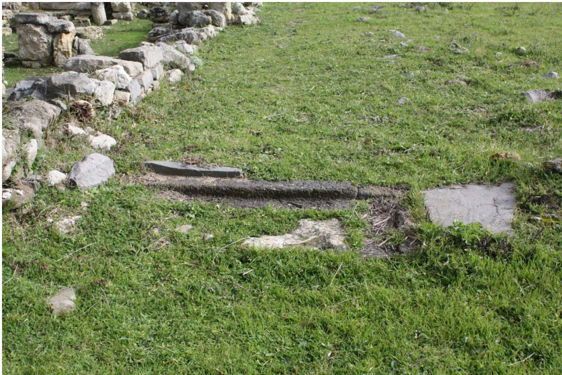
Fig. 2 - Soglia d'ingresso al quadriportico.

Gli ambienti individuati sono stati indagati parzialmente: i dati emersi e l'impossibilità di una diversa ubicazione attorno al complesso 4 hanno indotto ad ipotizzare che facessero parte del palazzo episcopale 5 . Questo sarebbe stato la residenza permanente o temporanea del vescovo della diocesi 6 : stabile nel qual caso la cattedrale di Columbaris fosse stata la principale sede della diocesi di Senafer/Cornus di cui parlano le fonti; provvisoria, nel caso in cui il complesso sia da interpretare come sede episcopale rurale, raggiunta occasionalmente dall'officiante, il quale avrebbe dovuto alloggiare in quel sito per qualche giorno, prima di affrontare nuovamente il viaggio di ritorno.