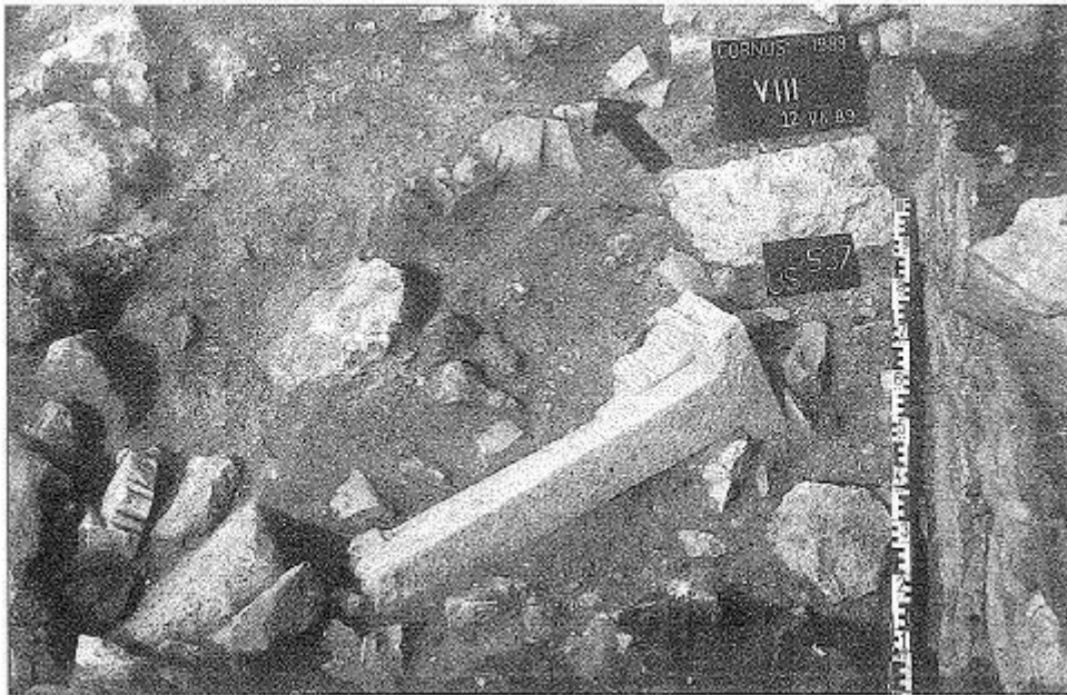
Fig. 3 - Bottega dello scalpellino (da Cornus I.1, p. 44, fig. 27).

Per alcuni ambienti, invece, è stata proposta una destinazione artigianale supportata dai ritrovamenti: un vano, verosimilmente la bottega di uno scalpellino (fig. 3), ha restituito numerosi frammenti lapidei. Esso era ubicato sul lato meridionale del cortile ed era caratterizzato dalla presenza di un bancale su tre lati, mentre l'ultimo era occupato da una scala. Il materiale litico si distingue fra pezzame non lavorato, elementi per lo più di tipo architettonico (figg. 4-5) 7 , appena sbozzati 8 , altri di riutilizzo 9 , altri ancora pronti per essere impiegati 10 .