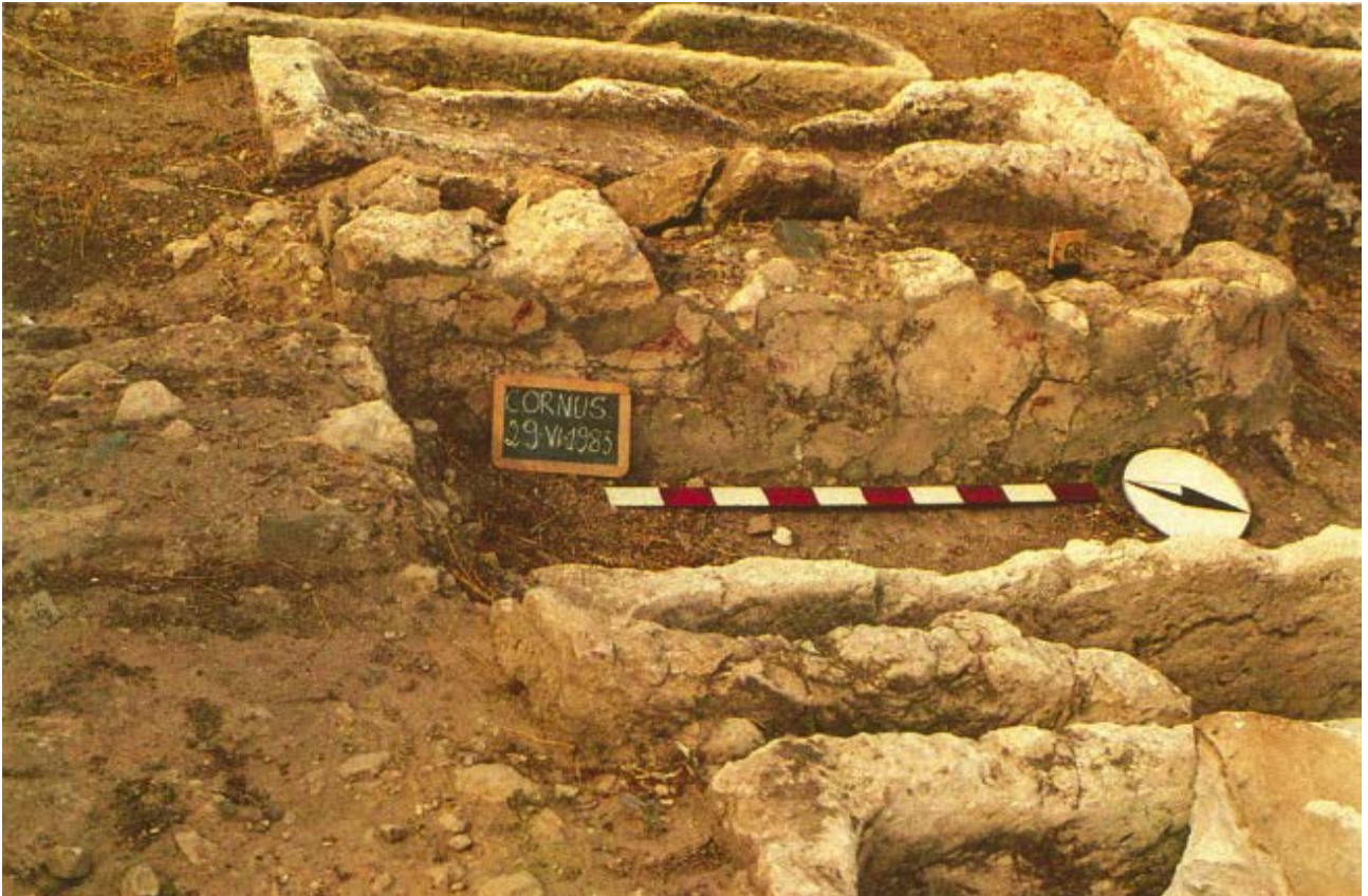
Fig. 2 - Tomba a tumulo 68 con labili tracce di pittura rossa, veduta da nord (da GIUNTELLA et al. 1985, tav. III, 1).

Successivamente venne impiantata una basilica cimiteriale che obliterò, e talvolta tagliò, le tombe già collocate nella stessa area 3 , mentre nella zona ad Est dell'edificio fu realizzato un terrazzamento che ospitò nuove sepolture, convenzionalmente definito IV,1 (fig. 3) 4 .