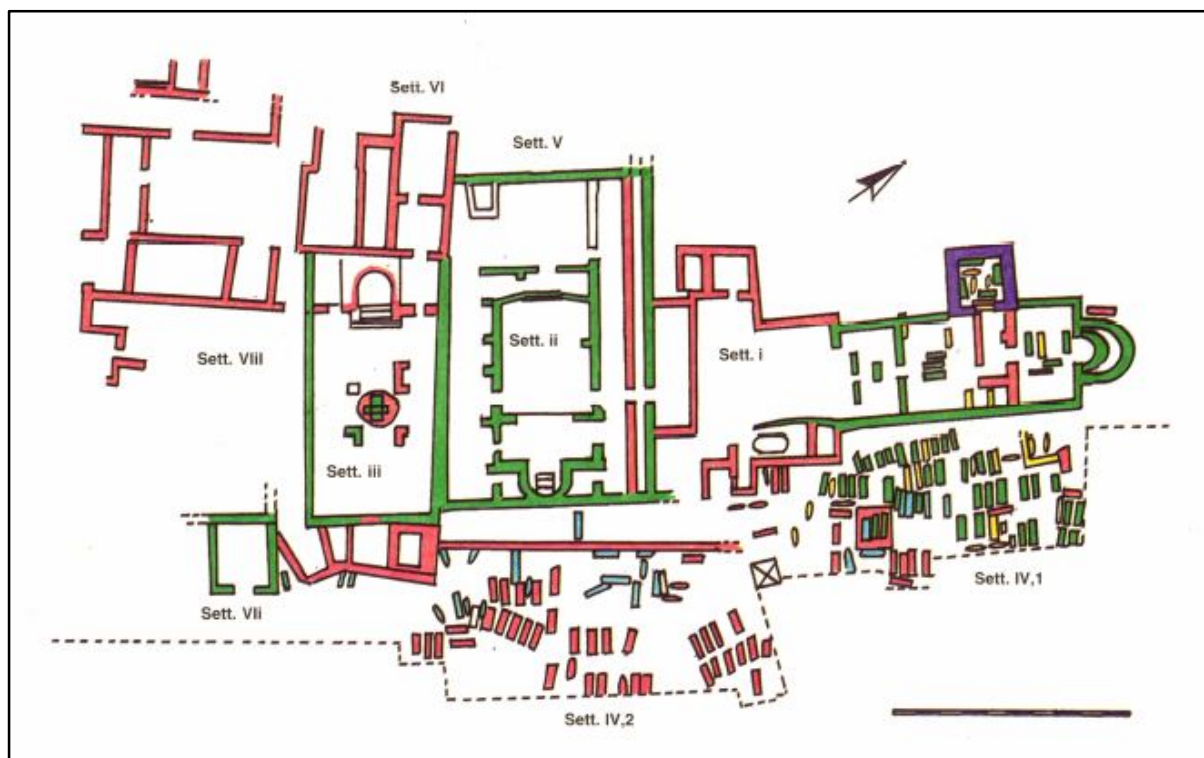
Fig. 4 - Planimetria del complesso di Columbaris-Cornus con indicazione delle fasi e dei settori (elaborazione grafica di L. SALADINO, M. C. SOMMA, da Cornus I.1, p. 200, tav. II).

I defunti poggiavano su un cuscino funebre, ricavato sul fondo del sarcofago, oppure realizzato con materiale ceramico o litico e talvolta alcuni di essi venivano inseriti con orientamento diverso per la presenza di altri inumati all'interno della stessa deposizione 7 . Alla fine del V secolo, l'assenza di nuovi spazi da destinare alle sepolture nel settore IV,1 determinò l'estensione dell'area funeraria nel settore meridionale - denominato IV,2 8 - a Est della basilica episcopale e di quella battesimale edificate almeno dal V secolo 9 . Il banco di roccia venne livellato e vi trovarono collocazione sarcofagi in calcare marnoso, alcuni di notevoli dimensioni. Durante lo stesso periodo l'area venne colmata da una massiciata 10 ,