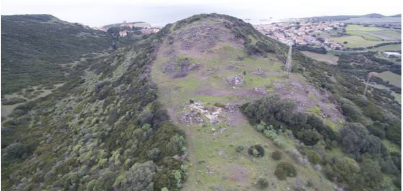
Fig. 1 - Collina di Corchinas.

La disfatta si fece preludio della conquista della Sardegna da parte dei Romani, che avvenne nel 238 a.C. e fu sancita nel 227 a.C. con la costituzione di una provincia che comprendeva la Sardegna e la Corsica. Durante il dominio romano, la città si impostò con buona probabilità sulla precedente e venne elevata al rango di municipium almeno dall'età Flavia o Traianea 7 . Nell'area circostante, in età imperiale, si diffuse l'insediamento sparso caratterizzato da ville, come nei casi di Sisiddo, Lenàghe e forse di Columbaris. In quest'ultima regione - posta nel suburbio settentrionale della città e servita da un diverticulum funzionale a collegare Cornus e Gurulis Nova 8 (fig. 2) - il rinvenimento di strutture impermeabilizzate con rivestimenti idraulici e cocciopesto ha portato ad ipotizzare l'esistenza di un complesso termale, verosimilmente legato alla villa suburbana. Di quest'area sono stati messi in luce 4000 m 2 attraverso le attività di scavo protrattesi per un ventennio,