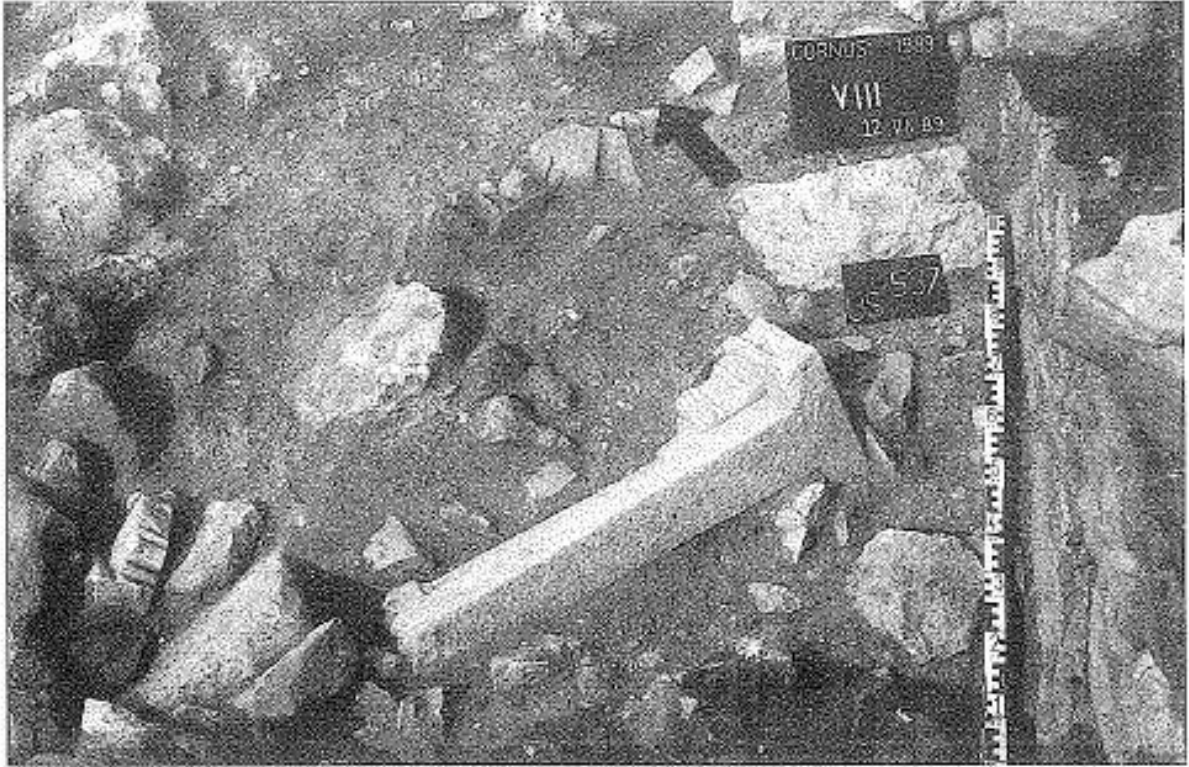
Fig. 10 - Bottega dello scalpellino (da Cornus I.1, p. 44, fig. 27).

Tra la fine del VI e l'inizio del VII secolo d.C. i sarcofagi subirono un riutilizzo dopo che le spoglie dei primi defunti furono deposte all'interno di ossari nelle stesse tombe, accanto al nuovo inumato: ciò avvenne soprattutto nell'area funeraria meridionale, mentre nel settore orientale, a Est degli spazi liturgici, vennero utilizzate sepolture antropomorfe 19 . I primi danni alle architetture furono determinati da un incendio che interessò soprattutto la basilica episcopale, che successivamente, tra la fine del VII e l'VIII secolo collassò nella parete orientale. Le macerie andarono a disporsi sull'area cimiteriale adiacente, obliterandola: tale evento comportò un graduale abbandono, prima riferibile alle basiliche, poi, lentamente, all'area sepolcrale.