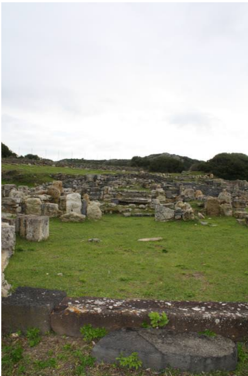
Fig. 7 - Chiesa cattedrale.

L'altare (fig. 8), invece, era situato in posizione mediana nella navata centrale ed era in origine sormontato da un baldacchino 16 .