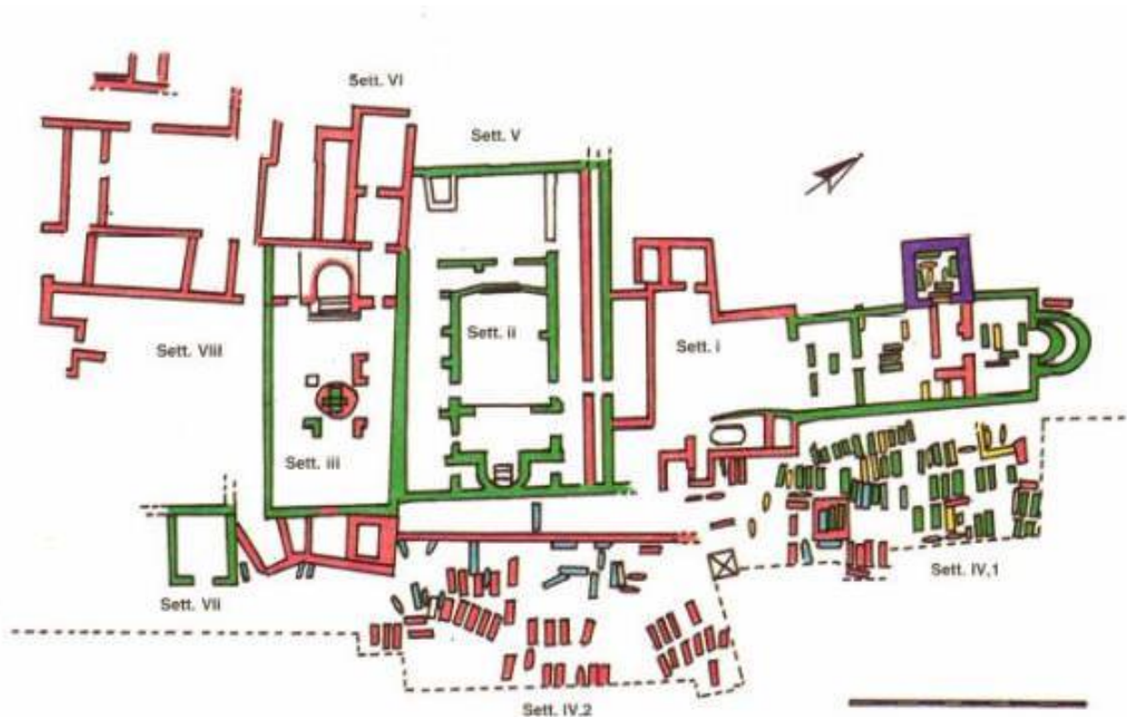
Fig. 3 - Planimetria del complesso di Columbaris-Cornus con indicazione delle fasi e dei settori (elaborazione grafica di L. SALADINO, M. C. SOMMA, da Cornus I.1, p. 200, tav. II).

Qui, su una collina digradante da Est verso Ovest, sorse una grande area cimiteriale subdiale che si estese progressivamente verso Sud. Il più antico utilizzo funerario si colloca nella prima metà del IV secolo, con la realizzazione di sepolture scavate direttamente nella roccia, parte delle quali occupavano una cisterna quadrangolare datata al III secolo d.C. 11 . Successivamente, un nuovo momento di risistemazione dello spazio funerario portò alla monumentalizzazione dell'area: il settore funerario settentrionale (settore IV,1 - fig. 3) venne organizzato su terrazze con una pendenza da Ovest verso Est e occupato da sepolture in sarcofago. Anche il piccolo vano-cisterna accolse nuove deposizioni: sulle sepolture più antiche coperte da lastroni litici vennero collocati quattro sarcofagi che fecero di questo spazio un sepolcro gentilizio, prerogativa mantenuta per tutta la durata di vita del complesso.