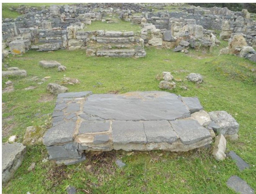
Fig. 8 - Altare in basalto con plinti laterali, veduta da Ovest.

La chiesa battesimale (fig. 9) era connotata dall'abside ad Ovest, dalla pianta trinavata, da un ingresso ad oriente poi tamponato e da un fonte battesimale.