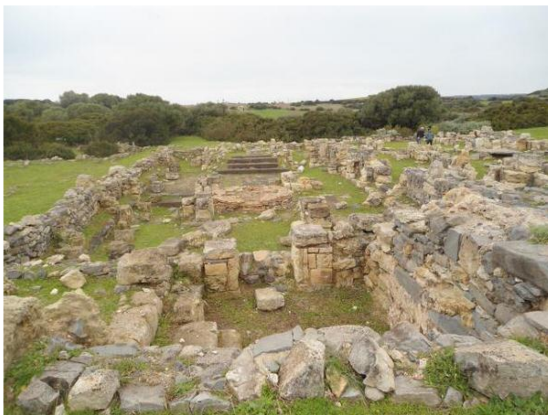
Fig. 9 - Basilica battesimale, veduta da Est (foto di C. Cocco).

La chiesa battesimale (fig. 9) era connotata dall'abside ad Ovest, dalla pianta trinavata, da un ingresso ad oriente poi tamponato e da un fonte battesimale.