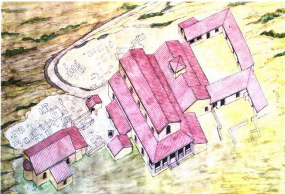
Fig. 5 - Ipotesi ricostruttiva del complesso di Cornus-Columbaris (da Cornus I.1, tav. III, p. 202).

Tra la seconda metà del IV e l'inizio del V secolo d.C., durante il dominio bizantino, si creò forse un dualismo all'interno del centro di Cornus 12 , che viveva il suo momento di maggior sviluppo: da un lato, è possibile vi fosse la città vera e propria, dotata di autonomia insediativa 13 ; dall'altro la costituzione della sede episcopale e della propria area cimiteriale (fig. 5) 14 . In questo momento, a Sud della basilica funeraria, vennero edificate due aule di culto parallele e comunicanti, ma con orientamento opposto: una maggiore, cosiddetta "episcopale" (fig. 6, n. 1; fig. 7), era il luogo preposto per la liturgia ordinaria, mentre quella meridionale (fig. 6, n. 2; fig. 8), di dimensioni inferiori, era esclusivamente destinata allo svolgimento dei riti connessi al battesimo.