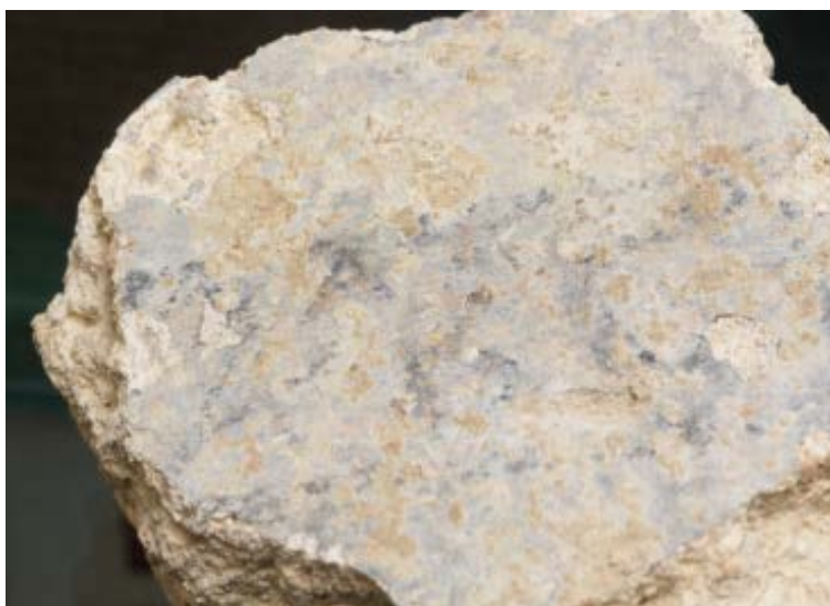
Fig. 1 - Iscrizione dipinta su intonaco.

Durante la campagna di scavi del 2001, un reperto singolare emerse dagli strati di riempimento della cisterna a bottiglia nel sito di Sant'Eulalia. Si tratta di un frammento d'intonaco grigio-celeste con iscrizione dipinta di colore scuro, recante in lettere capitali la radice arch -inquadrata tra due linee parallele (figg. 1-2).