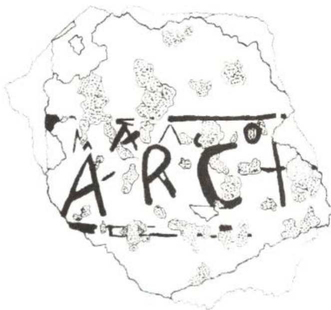
Fig. 2 - Riproduzione grafica del frammento d'intonaco dipinto (da MURA 2008 p. 280, fig. 2).