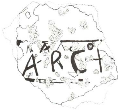
Fig. 6 - Riproduzione grafica del frammento d'intonaco dipinto (MURA 2008, fig. 2, p. 280).

Si delinea, quindi, un contesto cronologico coevo alla costruzione del porticato (IV sec.) sino a raggiungere il secolo successivo (V sec.). Singolare è la cronologia delle monete rinvenute nella stessa collocazione attestanti la pratica di creare tesoretti e quella dell'utilizzo dei salvadanai 5 : le monete riportano ad un arco cronologico riconducibile ai secoli dal I al V 6 e potevano avere lungo utilizzo in quanto la pratica della tesaurizzazione non comportava una svalutazione quanto un acquisto di valore. Il terminus post quem del V secolo potrebbe far immaginare un'inspiegabile dismissione della riserva idrica estremamente precoce rispetto alla vita del sito. La defunzionalizzazione certamente è attestata all'incirca nel VI secolo quando anche il porticato iniziò ad essere interessato da crolli e un lento degrado comportò il riutilizzo dei suoi elementi costruttivi, i quali vennero poi accumulati all'interno dell'ampio serbatoio. Vi trovarono collocazione le tegole 7 che ricoprivano il tetto spiovente della porticus , frustoli di intonaco dipinto proveniente dal muro di fondo, dal rosso acceso, ed un frammento di intonaco con l'iscrizione arch 8 (fig. 6).