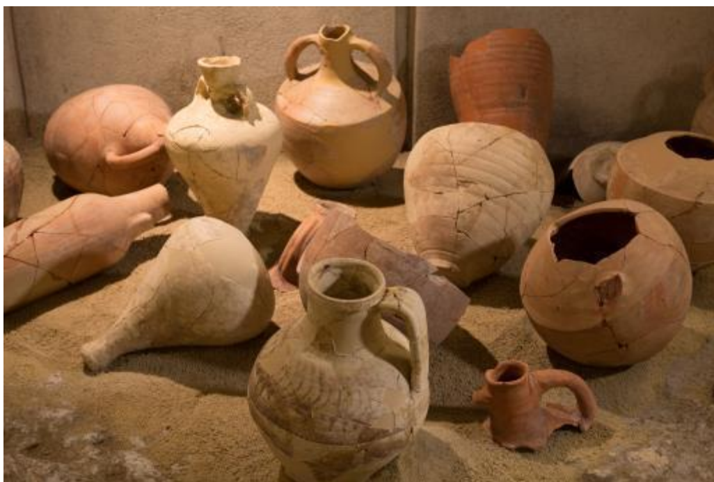
Fig. 2 - Anfore e brocche restaurate: in primo piano una brocca in ceramica fiammata (Unicity S.p.A.).