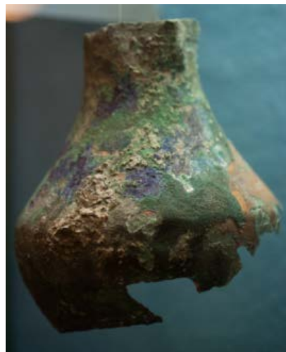
Fig. 5 - Brocca in bronzo mutila con concrezioni e patine (Unicity S.p.A).