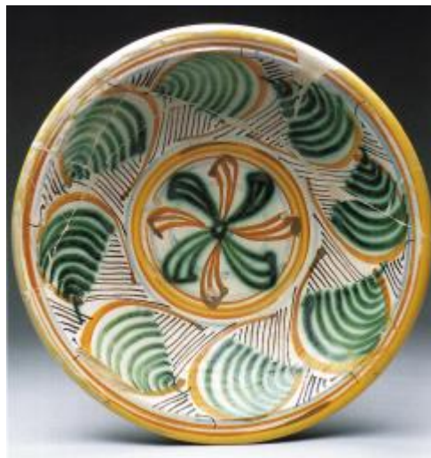
Fig. 4 - Catinella in maiolica di Montelupo Fiorentino, 1730-1760 (BERTI 1998, Tav. 366, p. 399).

Questa tipologia viene prodotta per un lungo arco di tempo, probabilmente dal 1570 al 1630 5 . Un'altra ipotesi interpretativa pone l'esemplare di S. Eulalia (fig. 1) in relazione con il tipo "a foglia di vite", diffuso per tutto il XVII secolo 6 . La catinella, invece, mostra una decorazione confrontabile con la tipologia definita "a spirali verdi", per la presenza nel cavetto della tipica decorazione a girandola verde e arancio (cfr. fig. 4).