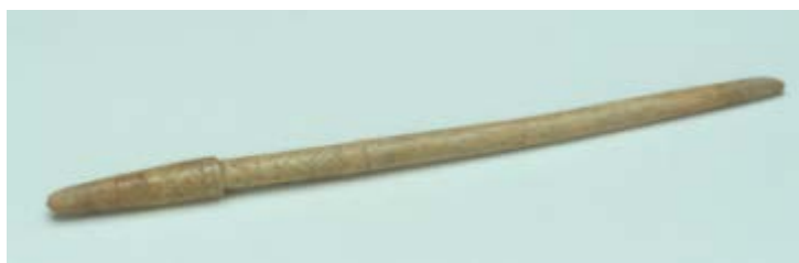
Fig. 2 - Ago crinale con decorazioni incise a zig-zag.

L'esemplare più caratteristico mostra un busto liscio e testa antropomorfa, del tipo "a busto femminile" 1 (fig. 1a) ed è riferibile cronologicamente all'Età Flavia (fine I-inizio II sec. d.C.) grazie ai confronti con il tipo di pettinatura dell'epoca 2 . Gli spilloni a testa con-