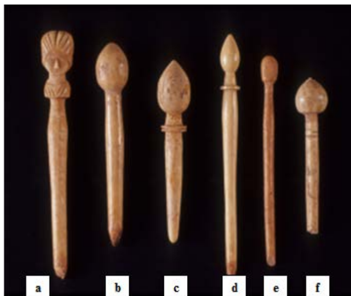
Fig. 1 - Aghi crinali in osso.

Dal riempimento soprastante il pavimento dell'area porticata proviene uno sparuto gruppo di aghi crinali in osso (figg. 1-2).