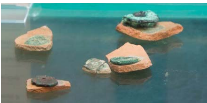
Fig. 1 - Monete ossidate su frammenti di salvadanai.

Tra i materiali e gli strati di limo che riempivano l'interno della cisterna campanulata, la cui bocca si apre nel cocchiopesto del portico nel quartiere tardoantico di Sant'Eulalia, sono stati individuati frammenti di ceramica comune sulla cui superficie interna si trovano ossidate alcune monete bronzee, talmente abruse da non permettere la lettura delle due facce e, di conseguenza, di determinarne la datazione (fig. 1).