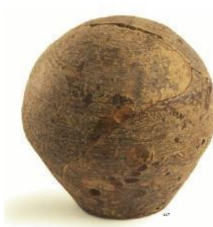
Fig. 4 - Salvadanaio da un silos del Duomo di Sassari, XIV sec. (da MARTORELLI 2007, fig. 147, p. 85).