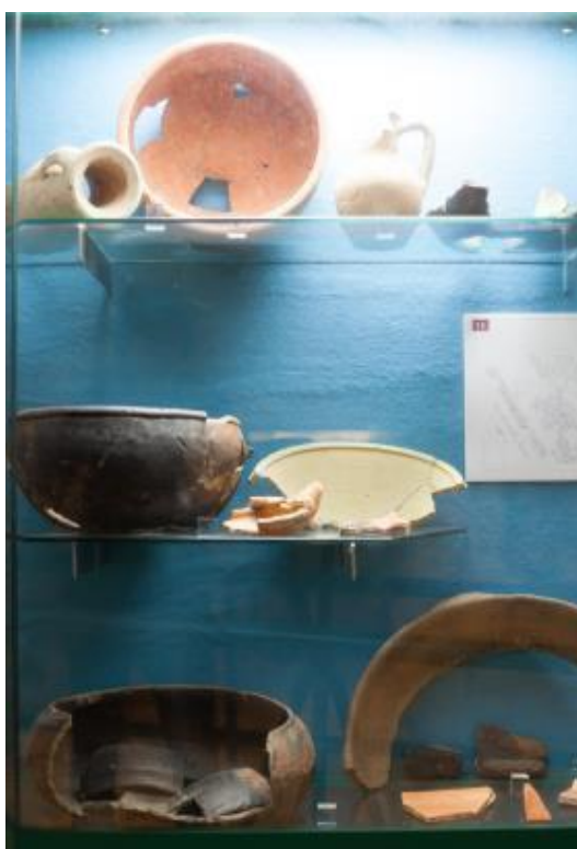
Fig. 3 - Materiali del condotto fognario in esposizione.

Tra i manufatti più caratteristici si individuano uno spatheion (fig. 3, in alto a sinistra), una brocchetta costolata bizantina 6 (fig. 4) e una lucerna paleocristiana (fig. 3). Alcune delle suddette produzioni ceramiche (africana da cucina, sigillata di tipo D, spatheion )