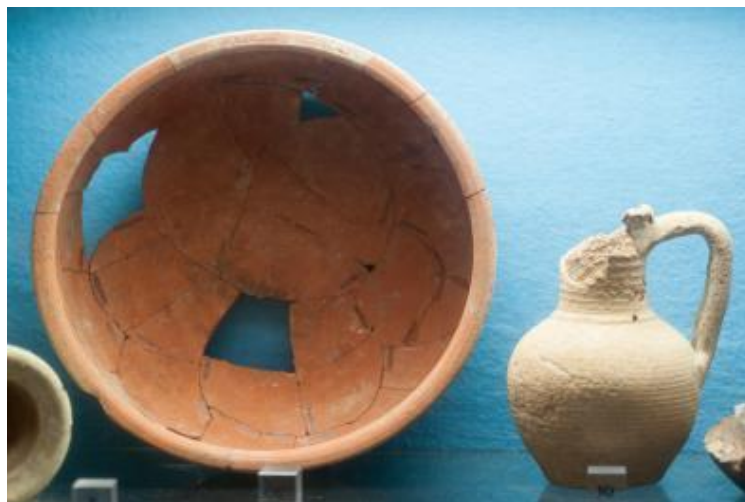
Fig. 4 - Dettaglio dell’esposizione: marmitta e brocchetta bizantina monoansata.

Le produzioni ceramiche rinvenute all’interno del condotto fognario sono attribuibili ad un arco cronologico compreso prevalentemente tra il IV ed il VII secolo d.C. I materiali furono rinvenuti fra il fango non defluito dal condotto a causa di un blocco litico che l’aveva ostruito e attraverso le loro cronologie hanno permesso di delineare la vita di questa porzione di quartiere dal IV secolo d.C. sino almeno alla fine del VII, terminus post quem della dismissione dell’infrastruttura sotterranea. Quest’ultima datazione sembrerebbe la più alta di tutto il sito 10 .