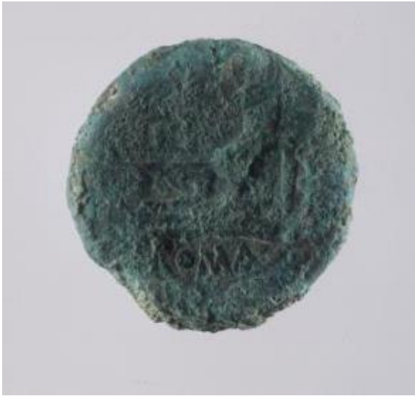
Fig. 3 - Moneta rinvenuta nel thesaurus : rovescio.

I manufatti bronzei documentano il continuo utilizzo di un santuario per diversi secoli, di cui era pertinenza lo stesso thesaurus . Da uno studio preliminare sulle prime monete restaurate è stato possibile identificare alcuni semiassi datati tra il III e il II secolo a.C. 2 ; mentre sono attestazioni dell'avvenuto predominio romano – nel 238 a.C. – alcune monete, le quali sull'esergo mostrano la dicitura ROMA, ipotizzata quale zecca di produzione (figg. 3-4).