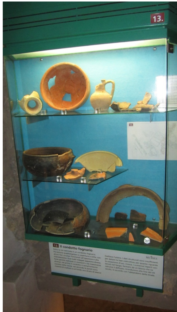
Fig. 5 - MUTSEU, vetrina espositiva all'interno dell'area archeologica (foto di Unicity S.p.A.).

Al di sotto del piano terra si raggiunge l'area archeologica musealizzata, durante il cui percorso su passerelle è possibile apprezzare alcuni reperti rinvenuti durante le campagne di scavo, così da avere una visione complessiva del ritrovamento del quartiere tardoantico e di mantenere gli stessi manufatti nel loro contesto originario (fig. 5) 2 .