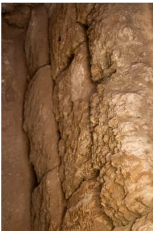
Fig. 2 - Blocchi bugnati a rivestimento del podio del santuario.

Della parte sommitale permangono sparute testimonianze architettoniche che non permettono la ricostruzione delle sue fattezze originarie: esse appaiono riferibili ad una piccola porzione di temenos (figg. 1 B, D, E, 3-4,), il quale doveva accogliere al suo interno il sancta sanctorum e il podio del thesaurus 2 .