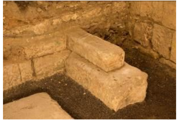
Fig. 4 - Particolare del lacerto angolare del temenos

Non è ancora certa la divinità titolare. Gli studi su santuari italici analoghi rivedrebbero in Apollo una fra le divinità più attestate in tali contesti 3 ; mentre l'ipotesi talvolta proposta vedeva in Baalshamem , divinità fenicia dei fenomeni atmosferici, il nume titolare del sacro luogo. Tale interpretazione sembra confermare le prerogative dei santuari dedicati al medesimo dio, i quali sorgono comunemente in aree esterne al centro abitato.