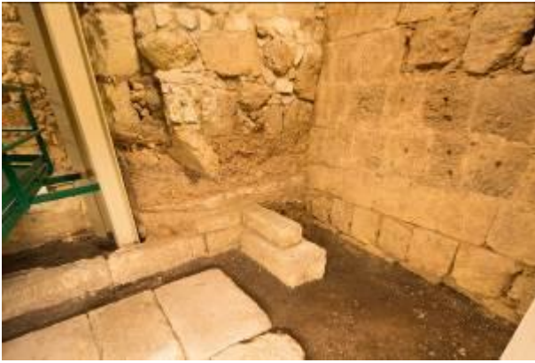
Fig. 3 - Tratto rimanente del temenos.