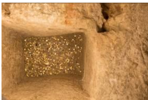
Fig. 3 - Thesaurus.

Sulla sommità del basamento si apre un pozzetto quadrangolare (cm 76x110), profondo cm 140 (fig. 4B, D, E). Al suo interno, ricolmo di terra e cenere, il pozzo ha restituito reperti ceramici e metallici, tra cui 307 monete bronzee databili dall'Età Punica a quella Romana 2 . Le attestazioni note sono state rinvenute in aree sacre urbane ed extraurbane dell'Italia centrale tardo-repubblicana, tra la seconda metà del II secolo a.C. e la prima epoca imperiale 3 .