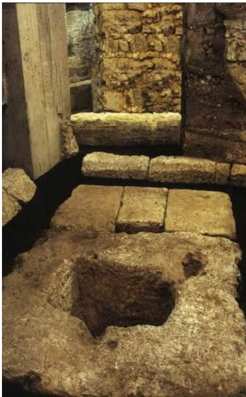
Fig. 1 - Thesaurus : podio affiancato da tre parallelepipedi.

Nell'area Nord-Ovest di Sant'Eulalia è stato rinvenuto un thesaurus , che da definizione «costituisce un piccolo monumento usato per la raccolta delle offerte monetali di un santuario, il cui modello è da ricercare negli usi dell'Oriente ellenistico, donde peraltro proviene uno dei più antichi esempi romano-italici» 1 . Il thesaurus calaritano si caratterizza per la presenza di un podio risparmiato nella roccia, a pianta rettangolare, orientato a NO-SE, di m 3 x 2, sul cui lato occidentale poggiano tre grossi parallelepipedi calcarei (figg. 1-4F).