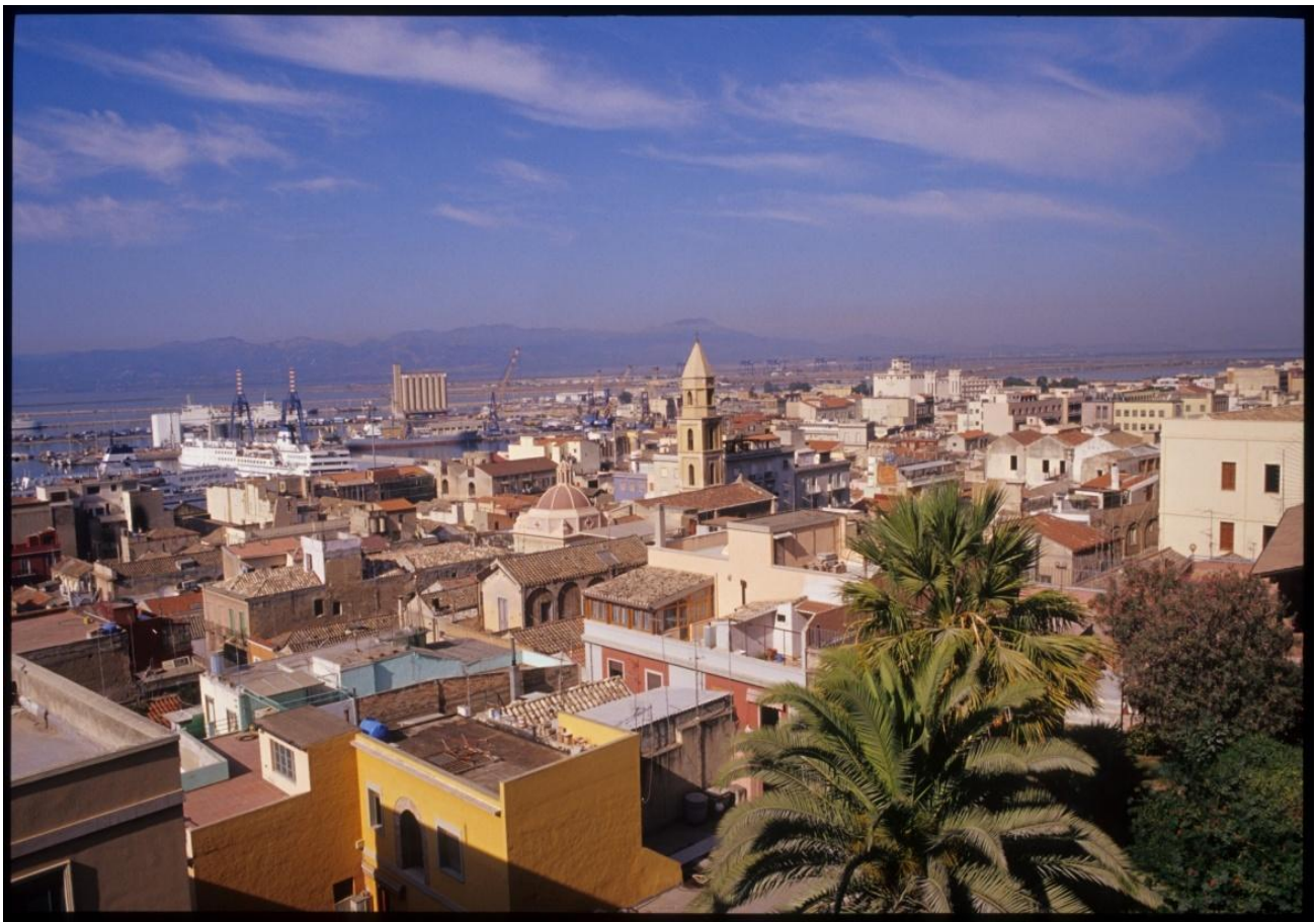
Fig. 4 - Panoramica del quartiere di Marina, in cui svetta il campanile di Sant'Eulalia.