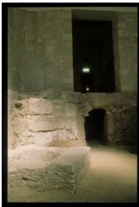
Fig. 1 - Il primo ritrovamento: ghiera del pozzo e setti murari secenteschi oltre la sagrestia.