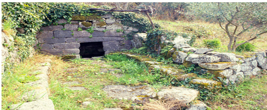
Fig. 1 - Fonte nuragica di Su Lumarzu (da http://www.sardegnaicultura.it/immagini/7_88_20070118152906.jpg ).

A fontana Lumarzu, presso Rebeccu a Bonorva (fig. 1), scoperta agli inizi del XX secolo e datata tra l'Età del Bronzo Finale e la Prima Età del Ferro, è stato rinvenuto un particolare vasetto miniaturistico quadriansato a carattere votivo (fig. 2).