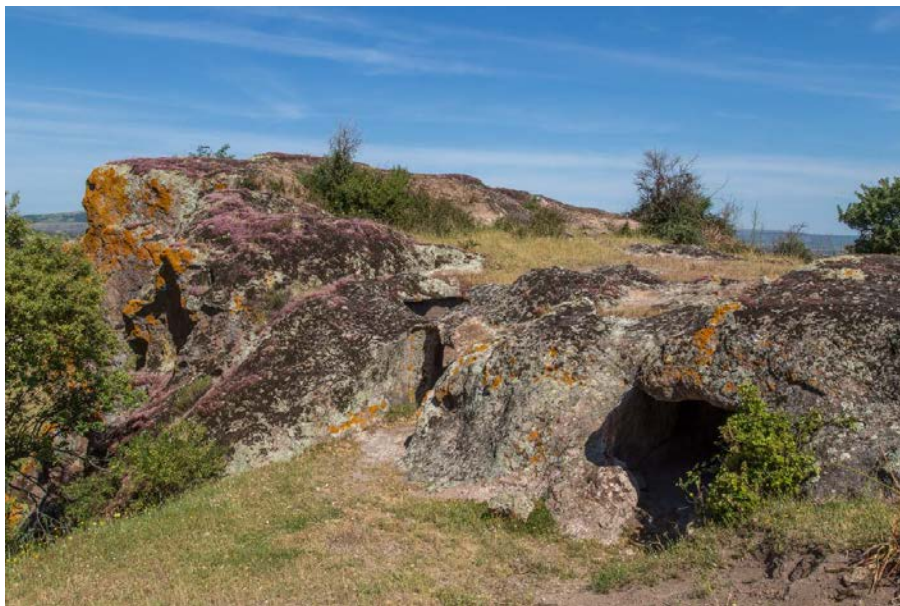
Figg. 1, 2 - Sulla destra, l'ingresso alla domus de janas XI.