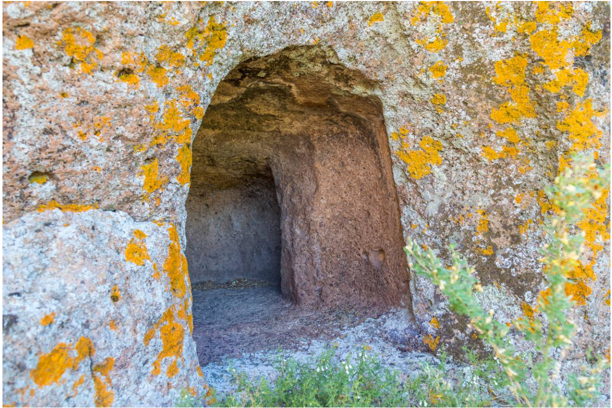
Fig. 5 - Ipogeo XV.