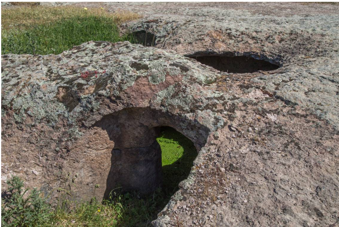
Fig. 3 - Ipogeo XII