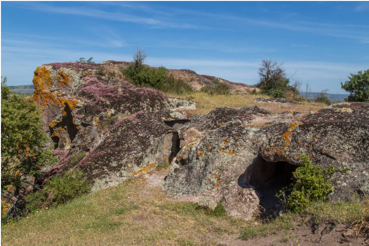
Fig. 4 - Gli ipogei XIII, XIV ubicati in cima al pianoro.

La domus de janas XIV (fig. 4) è di tipologia semplice monocellulare. Composta da un piccolo corridoio scoperto ( dromos ), il cui tratto finale, coperto, rappresenta l'anticella. Da un portello con soglia rialzata, si accede alla cella, il cui soffitto piano oggi è in parte crollato. Comunica con l'attiguo ipogeo XIII tramite un portello aperto nella parete di Sud - Est. La cella presenta nella parete di Nord - Ovest una nicchia.