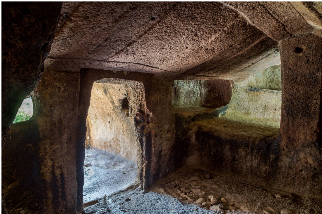
Figg. 2, 3 - Particolare del soffitto che caratterizza la domus de janas VIII di S. Andrea Priu, conosciuta come "Tomba a camera".

Il tetto è sostenuto da due pilastri, uno dei quali (quello di sinistra) poggia su di un banco funerario risparmiato sul lato di sinistra, creando due finte nicchie (figg. 4 , 5).