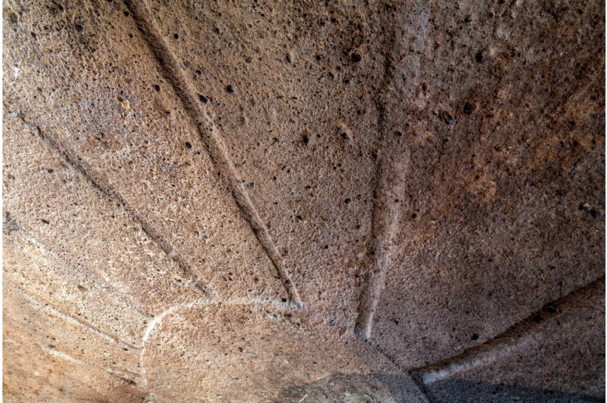
Fig. 2 - Il soffitto dell'anticella.

Il soffitto, spiovente verso l'ingresso, riproduce le travi lignee che sorreggevano il tetto della capanna preistorica (fig. 2).