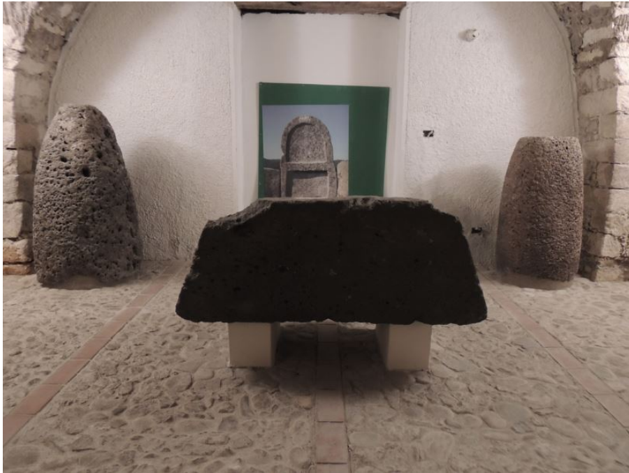
Fig. 3 - La sala nuragica.