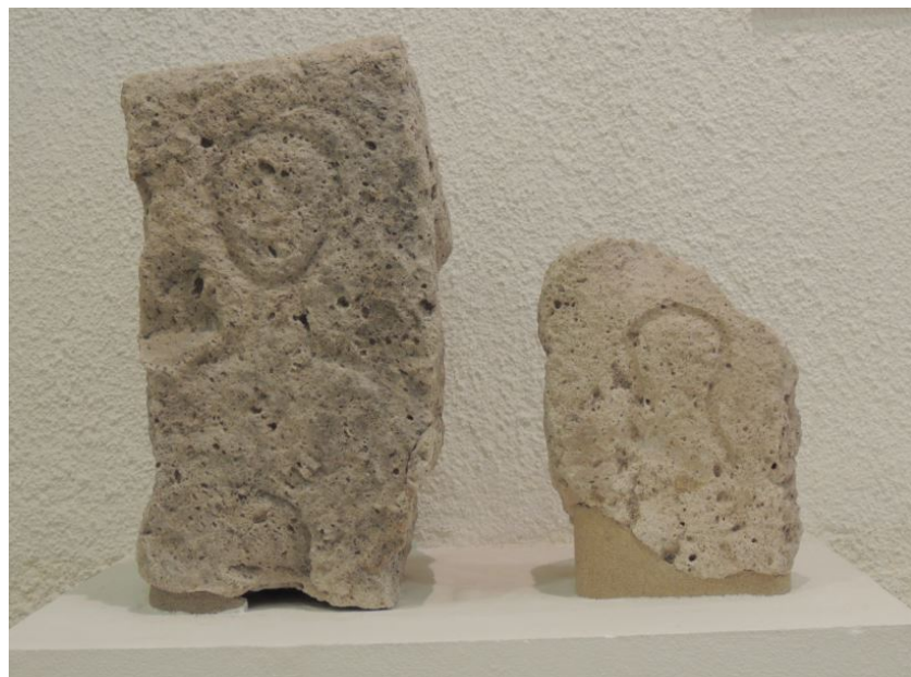
Fig. 5 - Stele figurate provenienti dalle tombe a fossa della località Su Terranzu.

Per l'età romana numerose sono le testimonianze, cippi funerari (fig. 5), sepolture, macine, iscrizioni (fig. 6), che riconducono a una serie di insediamenti diffusi sulle colline, nelle pianure e lungo i corsi d'acqua.