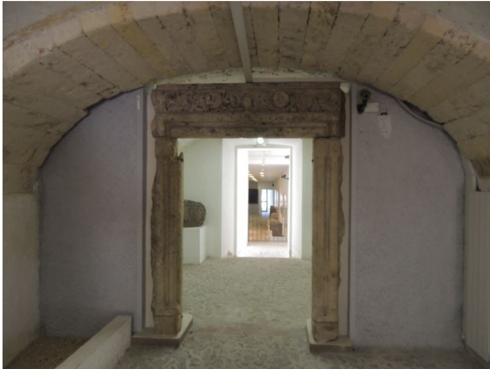
Fig. 2 - L'interno del Museo con ricostruzione di un portale in pietra del XVII secolo.

Il percorso museale illustra, seguendo un percorso cronologico, la presenza dell'uomo nel territorio e integra il ricco patrimonio di oggetti esposti con pannelli divulgativi, che aiutano a collocare ogni singolo reperto nel contesto monumentale di provenienza.