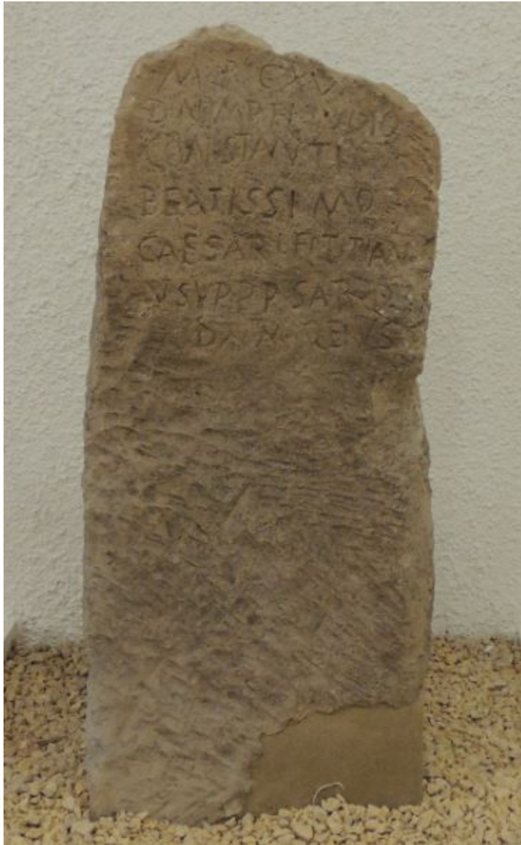
Fig. 1 - Miliario dalla località Mura Menteda, Museo Archeologico di Bonorva.