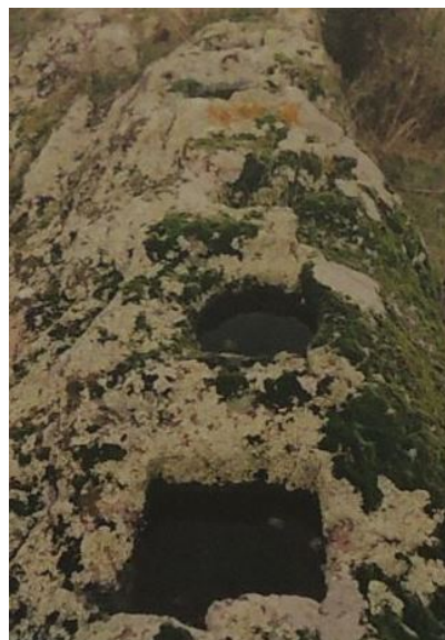
Fig. 3 - Necropoli di Su Terranzu.

Era, inoltre, frequente segnalare le tombe con le stele figurate funerarie ad incisione, collocate verticalmente al di sopra della sepoltura. A Su Terranzu ne sono state recuperate