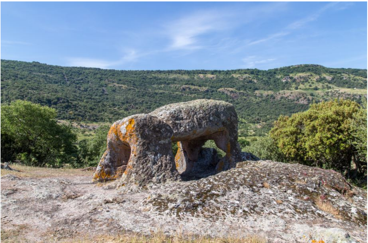
Fig. 1 - Il cosiddetto “campanile” o “toro”.

Sulla sommità della collina in cui è stata scavata la necropoli ipogeica di Sant’Andrea Priu, oltre ad alcune domus de janas , si trova anche una caratteristica roccia, nota come il “Campanile” o il “Toro”, che si presenta come un masso trachitico a forma di tavola orizzontale sorretta da pilastri (fig. 1).