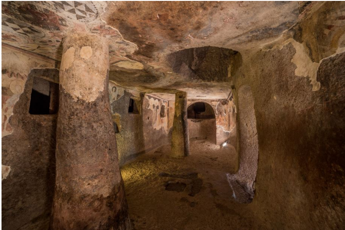
Fig. 5 - Le figure degli Apostoli all'interno del bema.

Le figure di cinque santi, riconosciuti come figure di apostoli dai nomi, occupano le pareti di destra, seguite da San Giovanni Battista, dalla Madonna e da ulteriori cinque apostoli o santi (figg. 5-6).