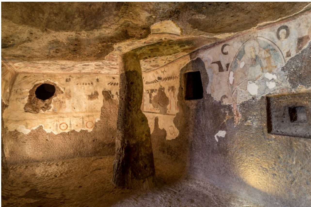
Fig. 2 - Affreschi con scene della vita di Gesù.

Sulle pareti all'interno del bema sono raffigurate, partendo dalla parete a sinistra dell'ingresso, alcune scene dell'infanzia di Gesù (fig. 2) accompagnate dalle immagini della mano divina benedicente (fig. 3), dei pavoni e dell'annuncio ai pastori.