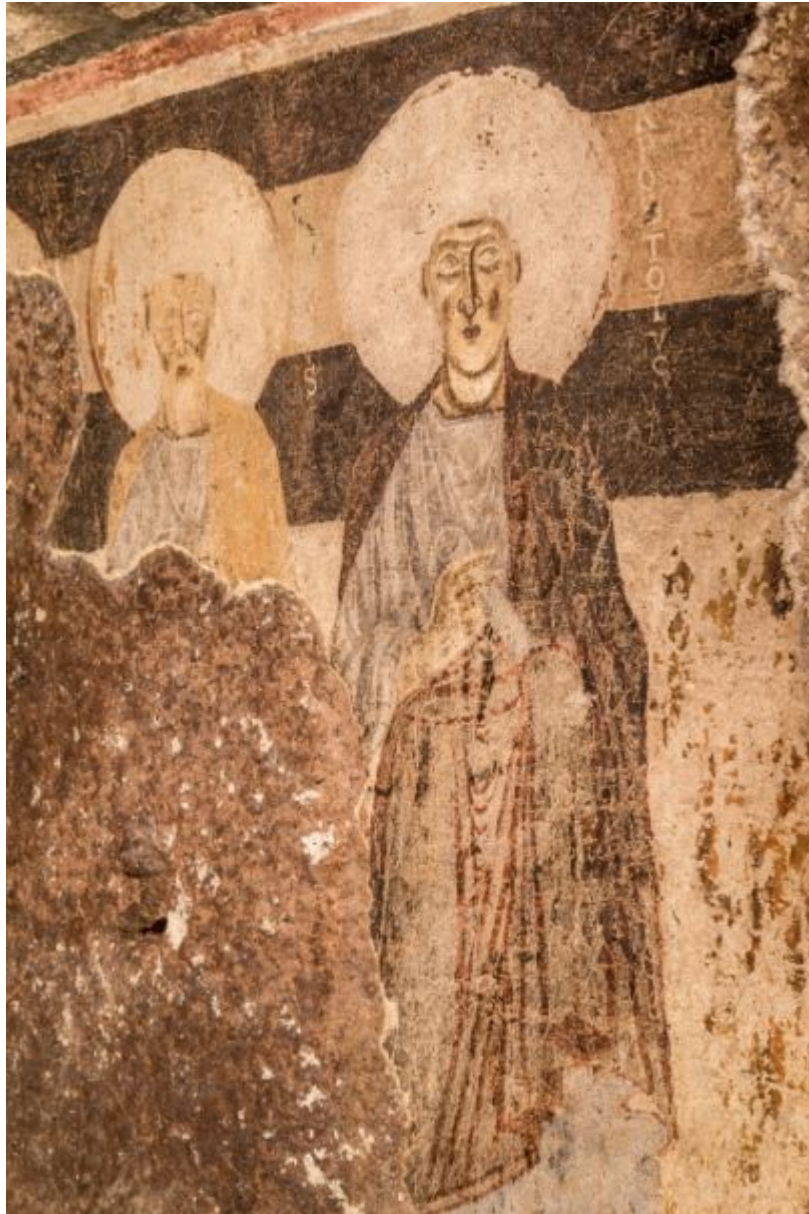
Fig. 6 - Gli apostoli.

Sotto l'affresco del Cristo benedicente è stato individuato un altro strato di pittura assai simile alle pitture della camera centrale, inerenti ad un primo uso cristiano della tomba preistorica. Dopo questo momento, per il quale non è possibile sapere se si trattasse di un uso di tipo funerario o culturale, sopraggiunse la modifica in chiesa, dimostrabile grazie alle immagini degli affreschi della stanza più interna.