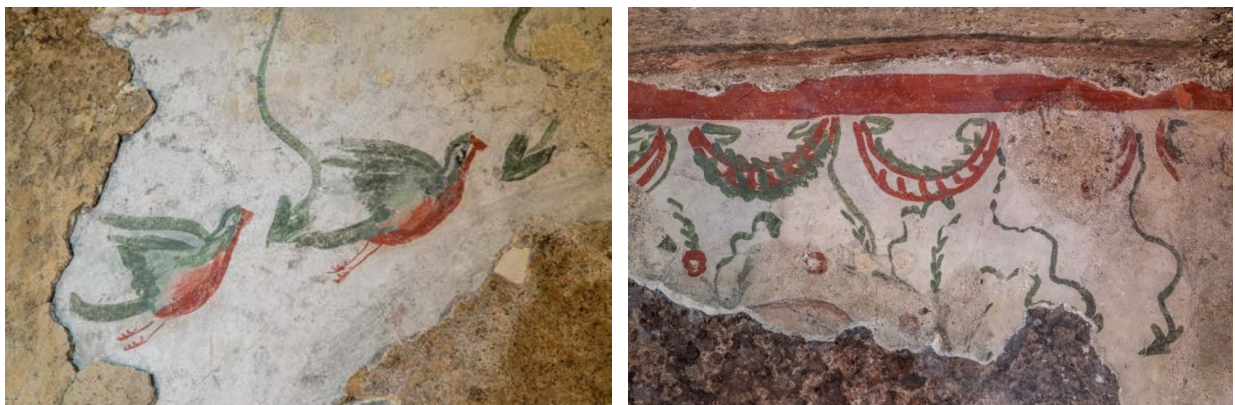
Fig. 3 - Uccelletti e festoni.