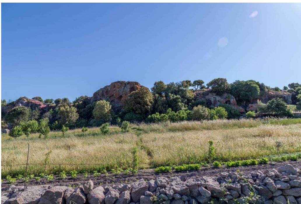
Fig. 2 - La parete in trachite in cui sono scavate le domus della necropoli di S. Andrea Priu.