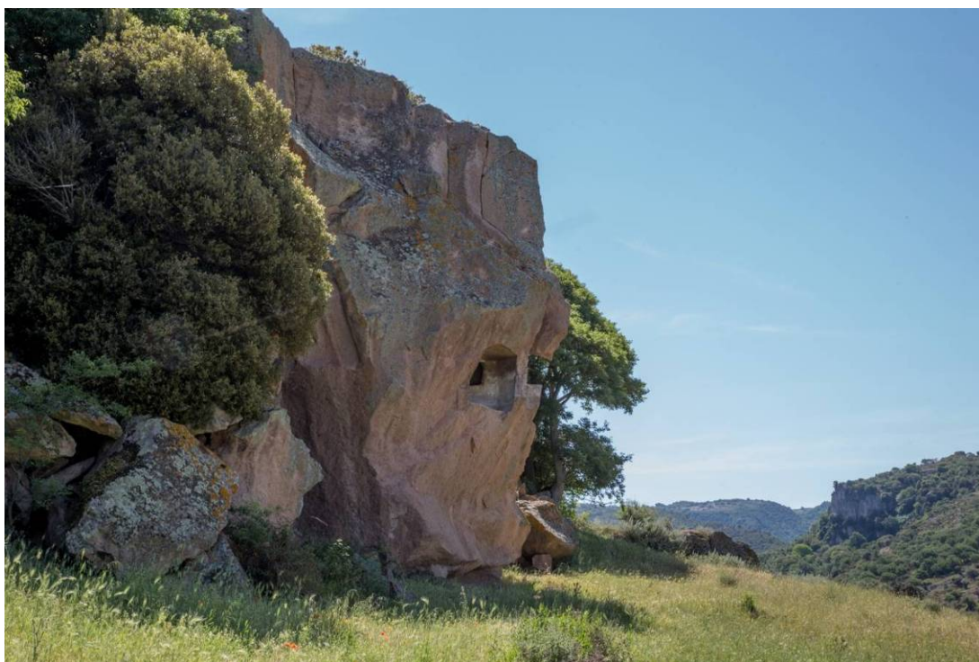
Fig. 16 - L'ipogeo X parzialmente distrutto dalle cariche di esplosivo nel 1967.

In cima al pianoro sono visibili domus di impianto più semplice (figg. 17, 18) e la roccia nota come il "Toro" o il "Campanile" (fig. 19), che si presenta come una tavola orizzontale sorretta da quattro pilastri. Probabilmente era in origine una tomba monocellulare realizzata scavando un masso sporgente dal bancone roccioso, le cui pareti furono successivamente abbattute.