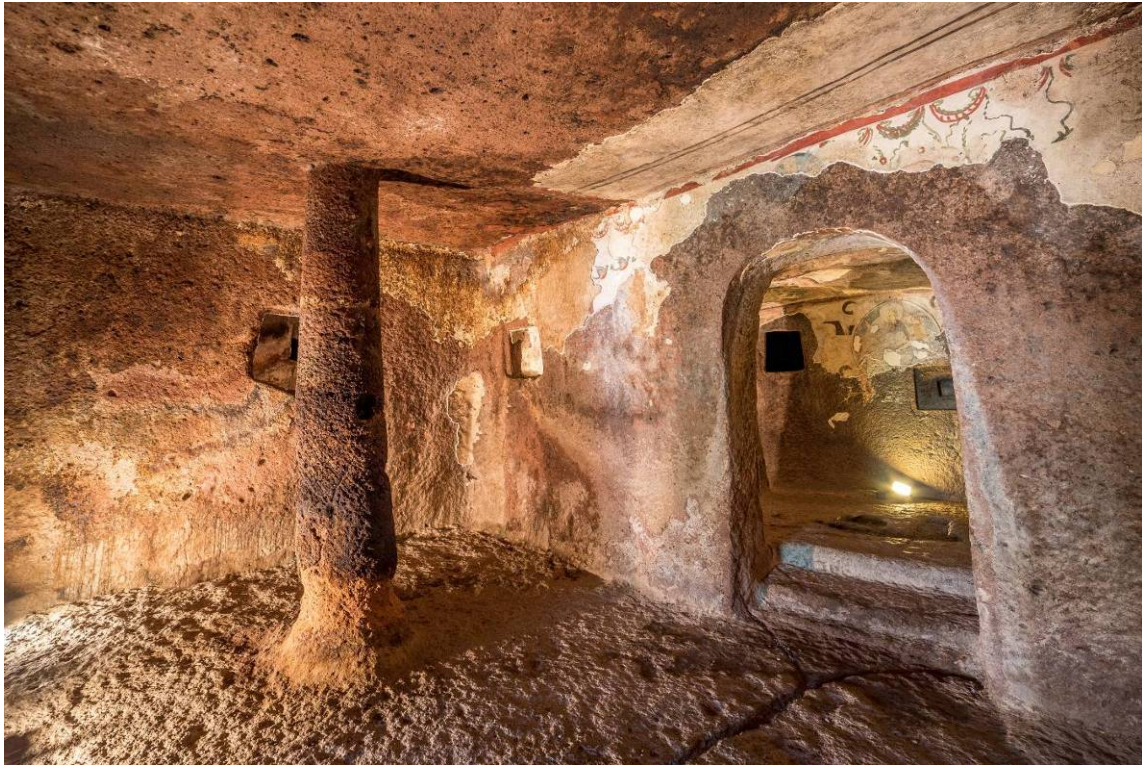
Fig. 10 - L'aula della domus de janas VI di S. Andrea Priu.

Nel soffitto dell'ultimo vano maggiore si apre un pozzo luce che raggiunge il pianoro sovrastante.