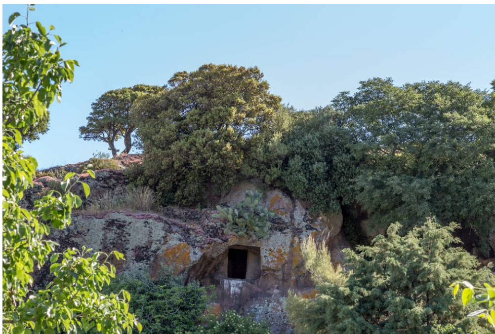
Fig. 3 - Particolare di una delle domus de janas di S. Andrea Priu.

La necropoli è composta sia da tombe monocellulari (con un solo vano), sia da ambienti maggiori a cui si raccordano celle secondarie (pluricellulari).