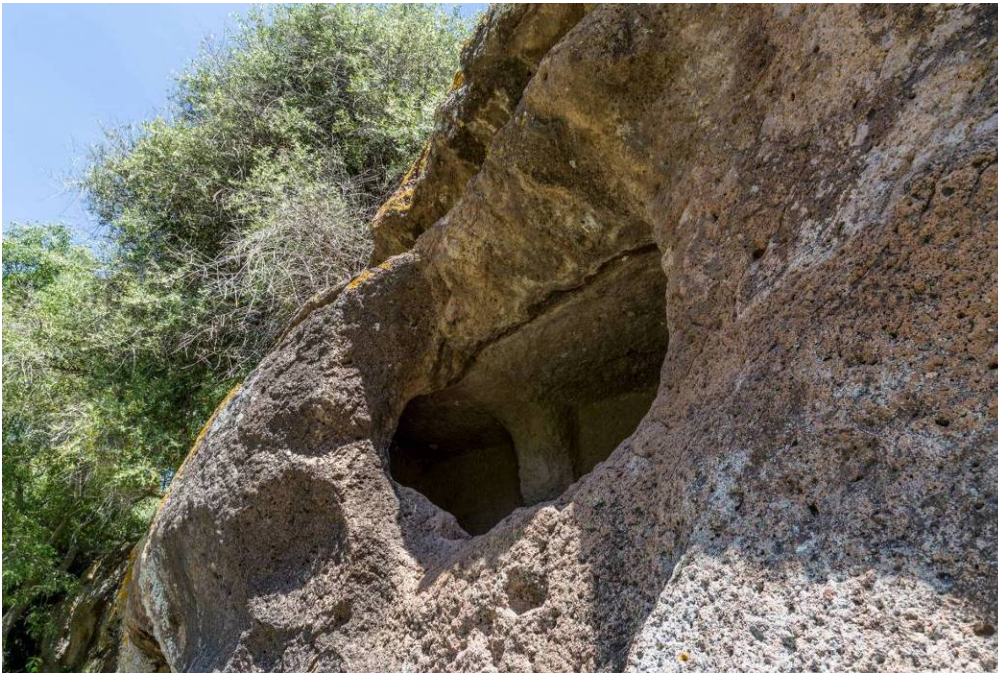
Fig. 5 - Particolare dell'ingresso della domus de janas V di S. Andrea Priu, altrimenti nota come "Tomba a capanna circolare" o "Tomba a domus ".

(fossette) emisferiche e una fossa rettangolare realizzata in Epoca Bizantina. Due ambienti di pianta irregolare, forse realizzati in una fase successiva, si aprono lungo i lati.