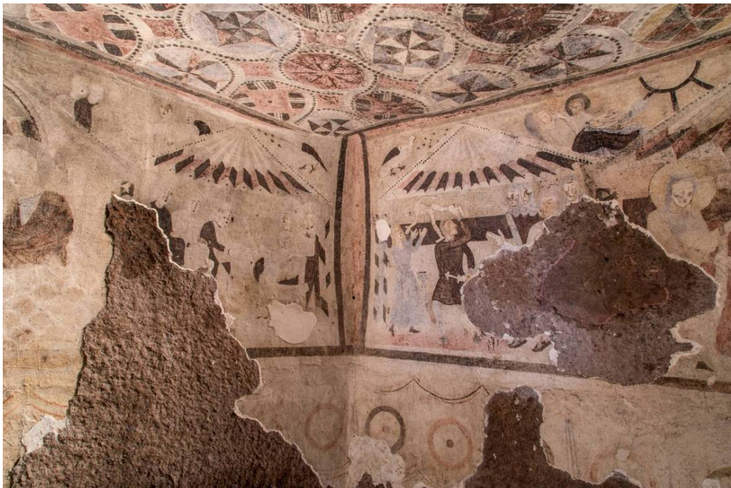
Figg. 13, 14 - Gli affreschi presenti lungo le pareti del bema della domus de janas VI di S. Andrea Priu.

A Età Bizantina sono ricondotte le due sepolture ricavate nel pavimento della prima cella (figg. 15).