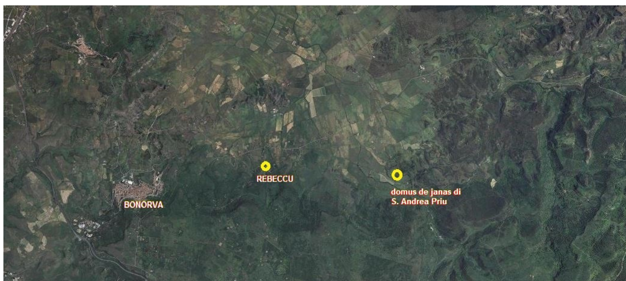
Fig. 1 - Bonorva, Rebeccu e il sito della necropoli di S. Andrea Priu.

Si tratta di sepolture ipogee caratteristiche della Sardegna Prenuragica datate alla metà del IV millennio a.C. e riconducibili al periodo della Cultura di Ozieri (Neolitico Recente 3200-2850 a.C.), evoluzione ed arricchimento di un tipo tombale già noto e specifico della cultura di Bonuighinu.