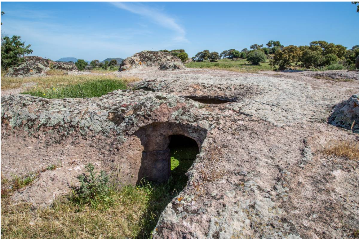
Fig. 17, 18 - Gli ipogei XIII, XIV e XII ubicati in cima al pianoro (foto di Unicity S.p.A.).