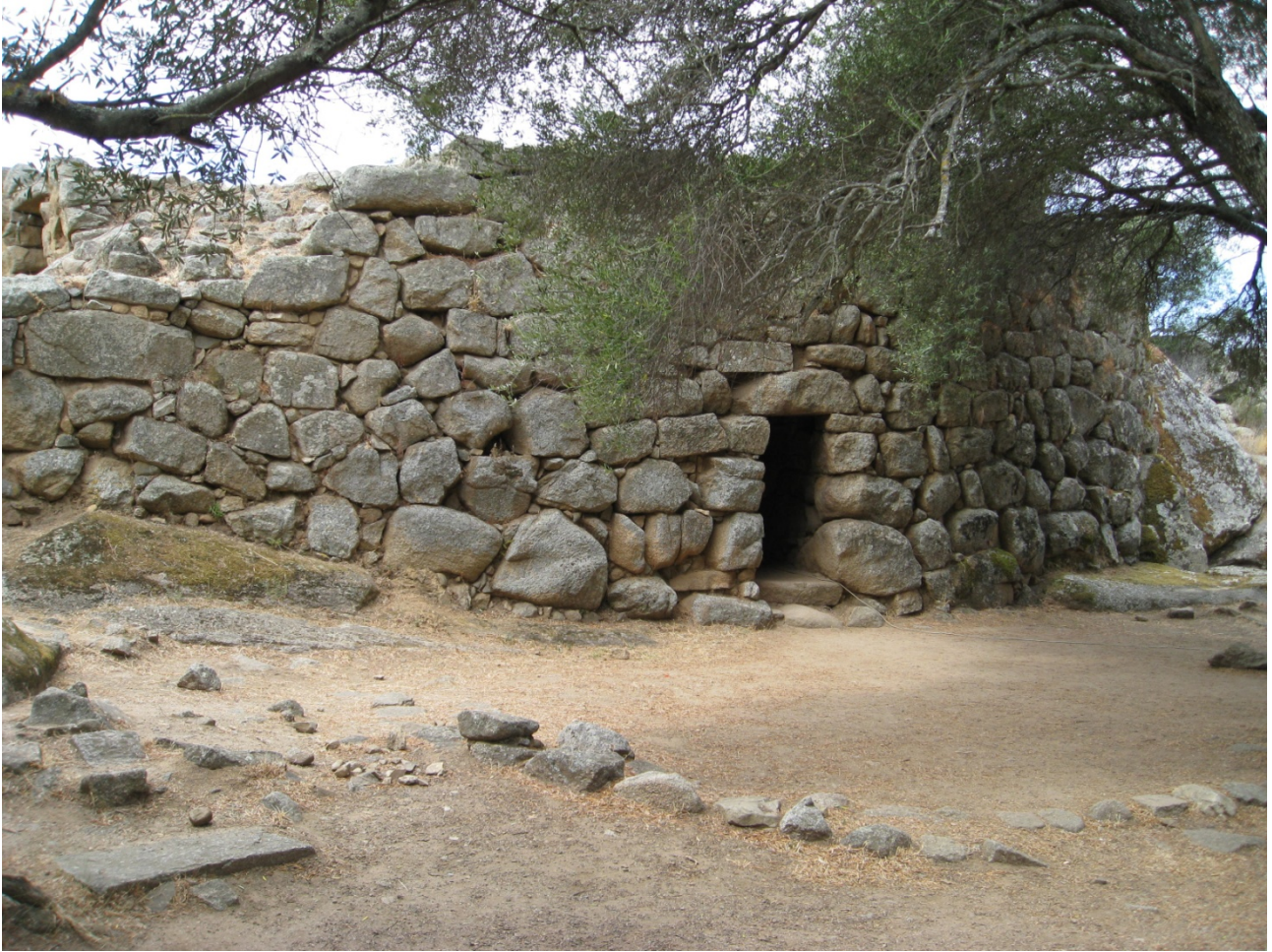
Fig. 2 - Nuraghe Albucciu.

Si tratta di un manufatto ceramico impiegato per la cottura di focacce. Il reperto, parzialmente ricostruito, è di foggia discoidale; si caratterizza per una leggera depressione centrale e orlo arrotondato (fig. 3).