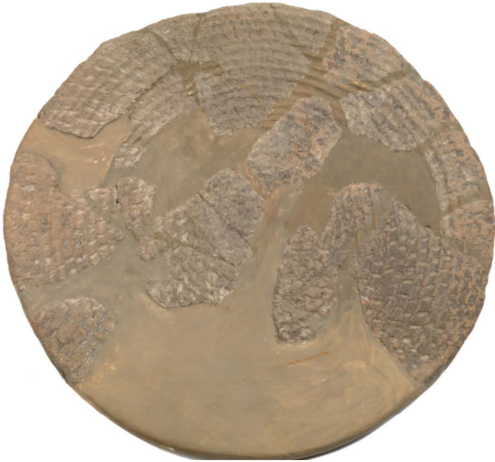
Fig. 4 - Spiana (da Fois 2014, p. 232).

L'ambito cronologico di riferimento è compreso tra il XIV e il XII a.C.