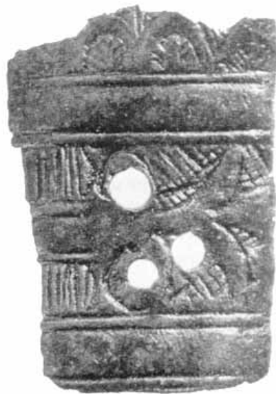
Fig. 3 - Nuraghe Albucciu: frammento di situla in bronzo (da ANTONA RUJU, FERRARESE CERUTI 1992, fig. 23, PAG.54).