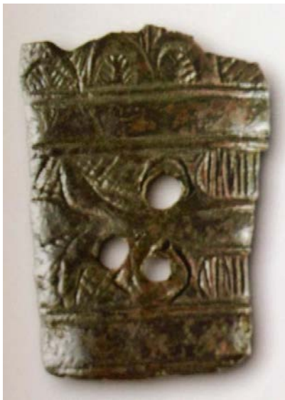
Fig. 4 - Particolare del frammento di situla in bronzo (da ANTONA 2013, p. 103).