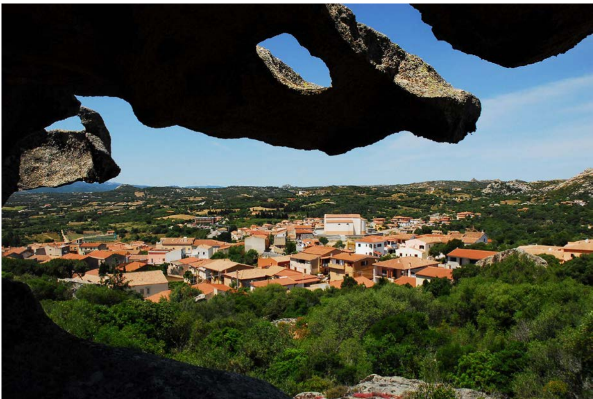
Fig. 4 - Arzachena, panoramica.

Nel 1922, dopo anni di dure lotte, ottenne l'autonomia da Tempio Pausania e da allora conobbe un continuo sviluppo urbanistico e demografico, ulteriormente amplificato negli Anni Sessanta del secolo scorso dal boom turistico della Costa Smeralda (fig. 4).