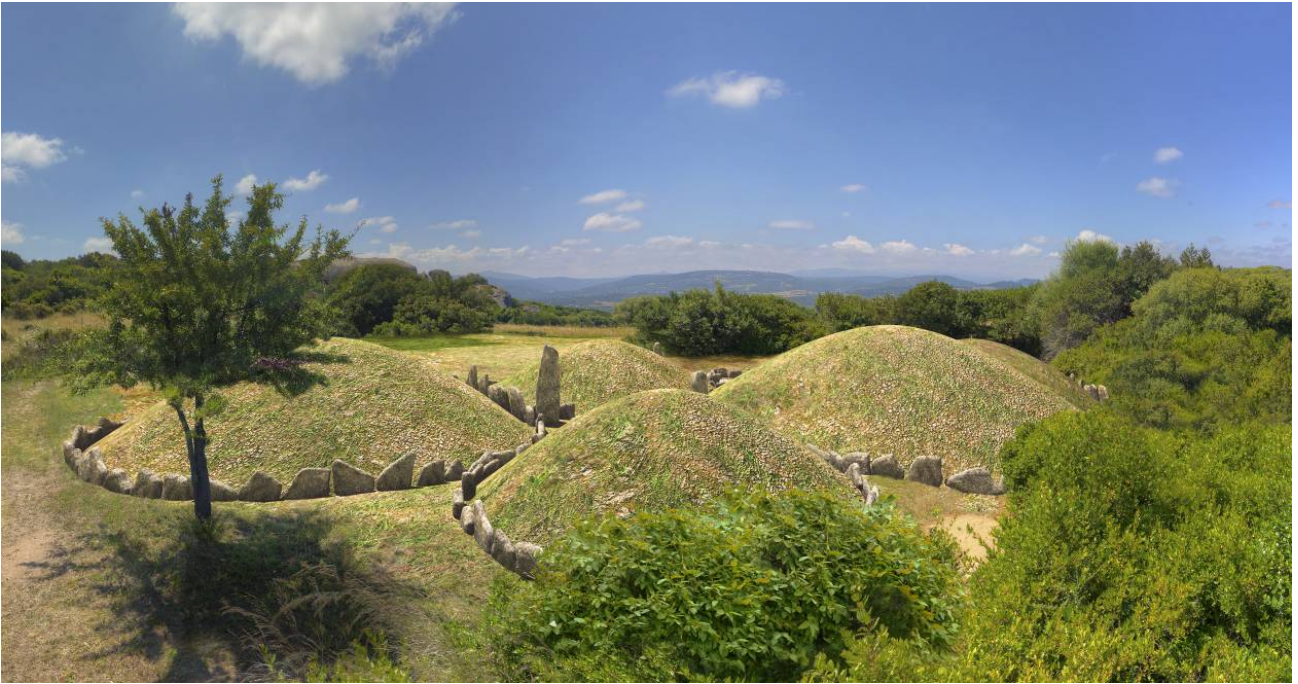
Fig. 3 - Render dei circoli funerari di Li Muri di Arzachena.