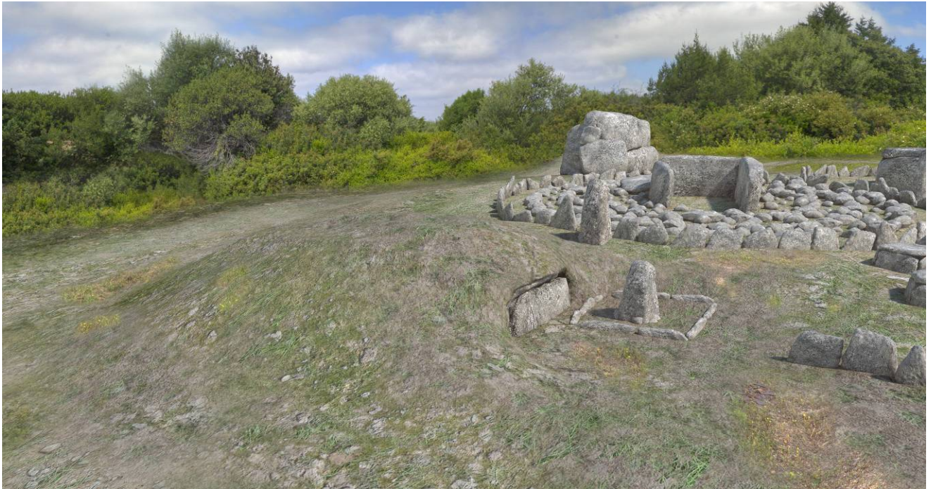
Fig. 3 - Render della tomba n. 5 della necropoli di Li Muri.

Nella tomba a cista con tumulo di La Macciunitta, sempre in agro di Arzachena, un menhir oblungo, ora rovesciato, era compreso fra le pietre della base del tumulo.